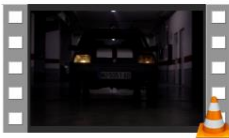
Fool and Furious

Presentación de Vídeo - FOOL AND FURIOUS