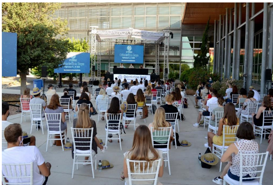
1Jornadas Bienvenida 21/22 Covid

Con ello se trabaja por garantizar la seguridad en las instalaciones, actividades y servicios dentro del campus de la UAL. Puedes consultar estas y otras medidas adoptadas frente al Covid-19 aquí .