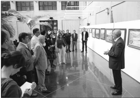
inauguración de una exposición en homenaje a Pedro Tirado.