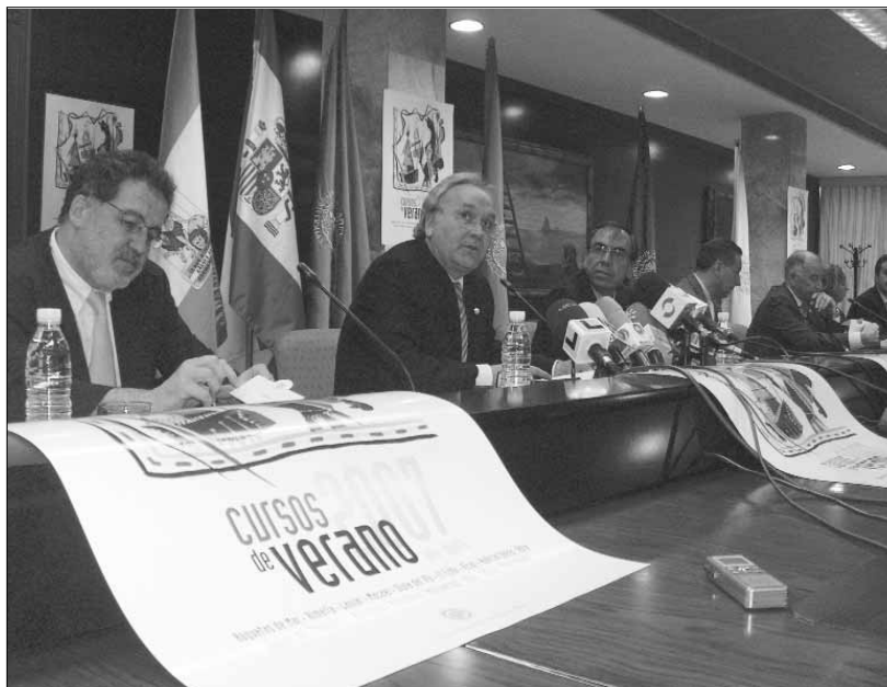
El rector presentaba los cursos con representantes de los ayuntamientos participantes.

En los cursos la demanda formativa de sus especialistas incluye ingenieros industriales, veterinarios, economistas, oftalmólogos, médicos, Colegio de Empresariales o el Colegio de Arquitectos. "Siempre nuestra idea ha estado en la colaboración con Colegios, fundamentalmente de titulaciones que no se imparten en nuestra Universidad como complemento formativo a nuestros estudiantes, que al no dispo-