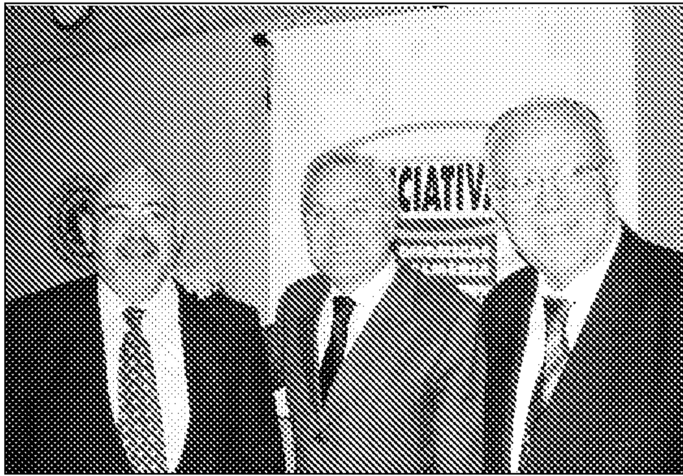
El rector, en el centro, junto a los miembros de CAES.