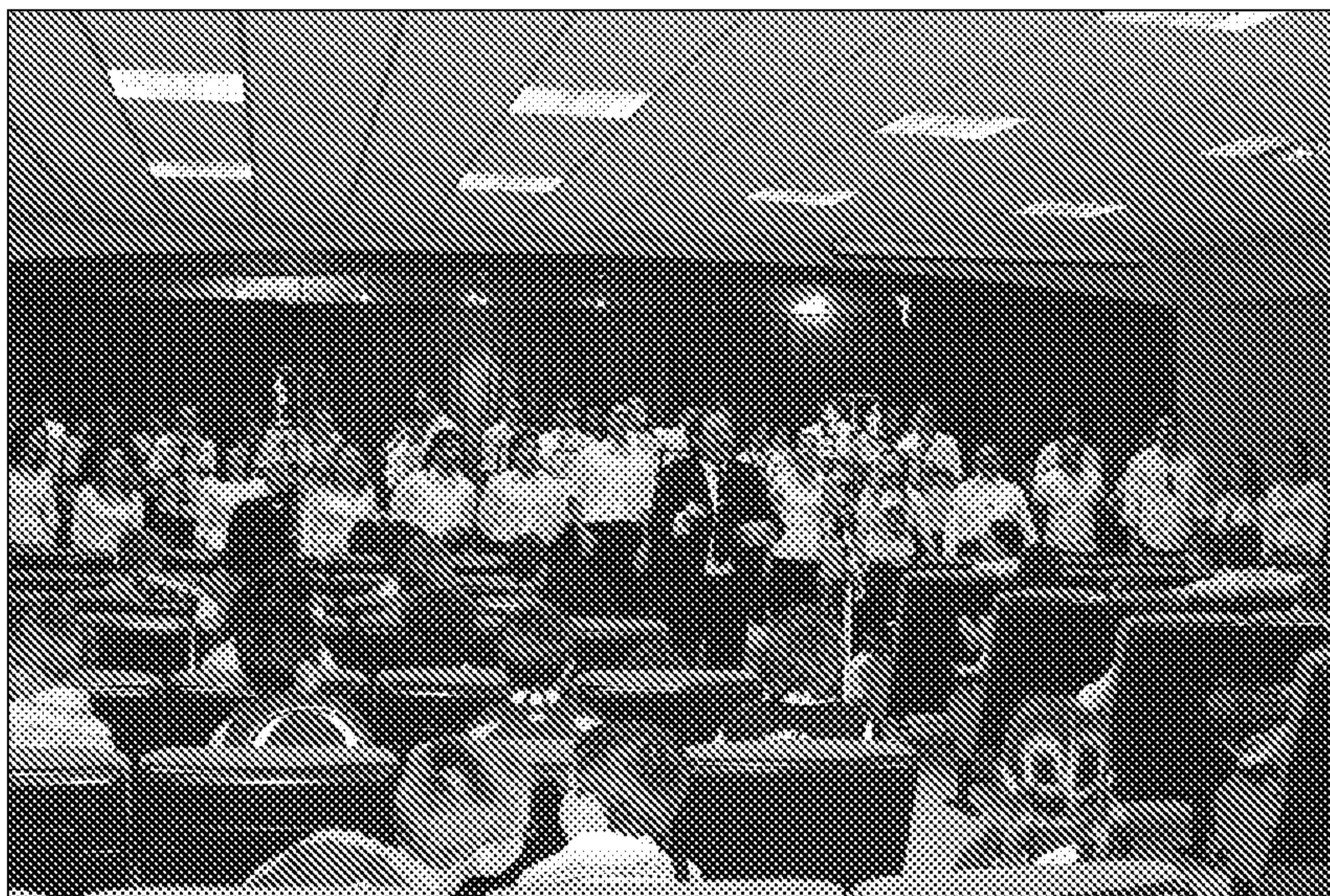
La Banda de Música celebraba el Día del Libro con los niños.

Además de los jóvenes que sobre el escenario componían la música, un nutrido grupo de jóvenes rodeaban las butacas del Aula Hospitalaria y acompañaban con sus voces la música que salía de los instrumentos.