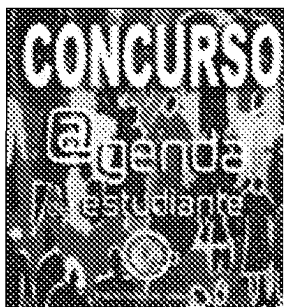
Imagen del cartel anunciador

es el de plica cerrada para asegurar la confidencialidad de los autores. Los trabajos se entregarán en el Centro de Información y Documentación Universitaria (CIDU). Teléfono de información 950 015873 / 950015080.