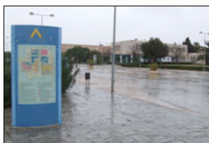
Universidad de Almería

ALMERÍA.- Las Pruebas de Acceso a la Universidad para los mayores de 25 años se celebran el viernes día 4 de mayo y el sábado 5 en el Aulario III del Campus de La Cañada. Estas pruebas constan de una primera parte común, que incluye a su vez tres exámenes, y una específica según la vía de acceso elegida por el aspirante, en concordancia con las vías de acceso del Bachillerato.