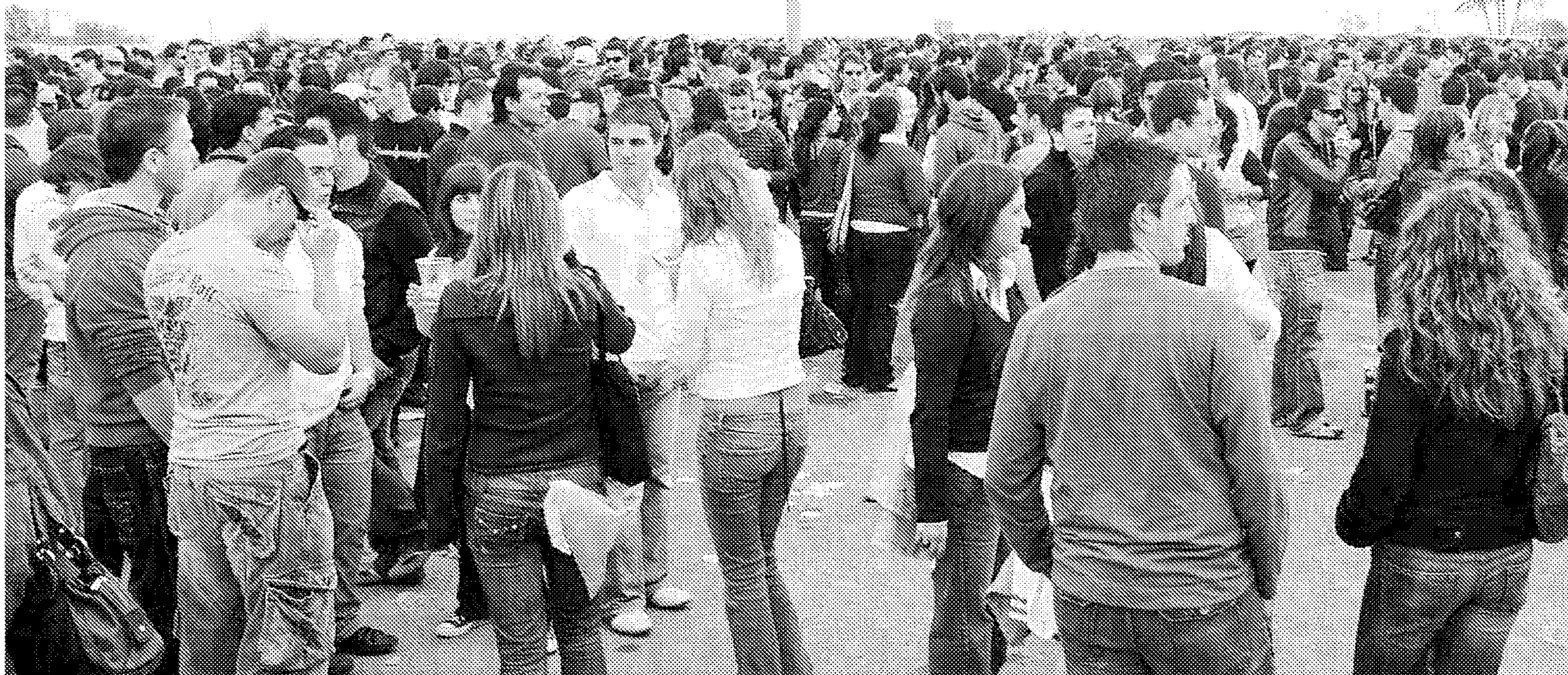
ÉXITO. Miles de universitarios, reunidos ayer en el campus, fuera de las aulas, se divierten a través de la música y la bebida.

Miles de jóvenes disfrutaron durante toda la jornada de ayer de la fiesta de la primavera