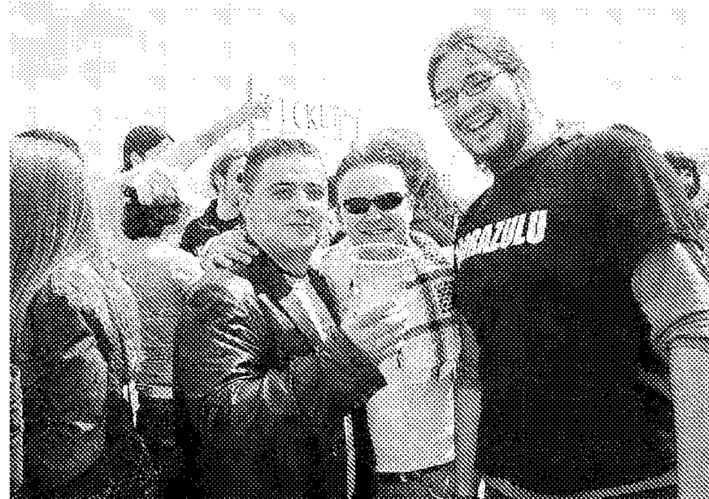
REENCUENTRO. Antiguos alumnos de la UAL, en el campus.

lo al tiempo que hablaban de sus cosas, de los estudios e, incluso, de las elecciones pasadas.