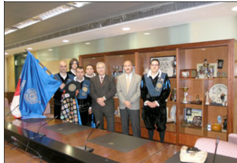
La tuna universitaria con la nueva bandera

ALMERÍA.- Hoy se ha presentado la nueva bandera-estandarte que la Tuna Universitaria portará a partir de ahora en todos aquellos eventos en los que participe, ya que la anterior no era representativa de la universidad actual, al no llevar el escudo de la Universidad de Almería. Esta nueva bandera es fruto de la colaboración entre la Universidad de Almería (a través del Vicerrectorado de Extensión Cultural) y el Ayuntamiento de Almería (Área de Gobernación). Ambas instituciones han aportado sus símbolos; la Universidad el Sol y el Ayuntamiento el Escudo de la Ciudad.