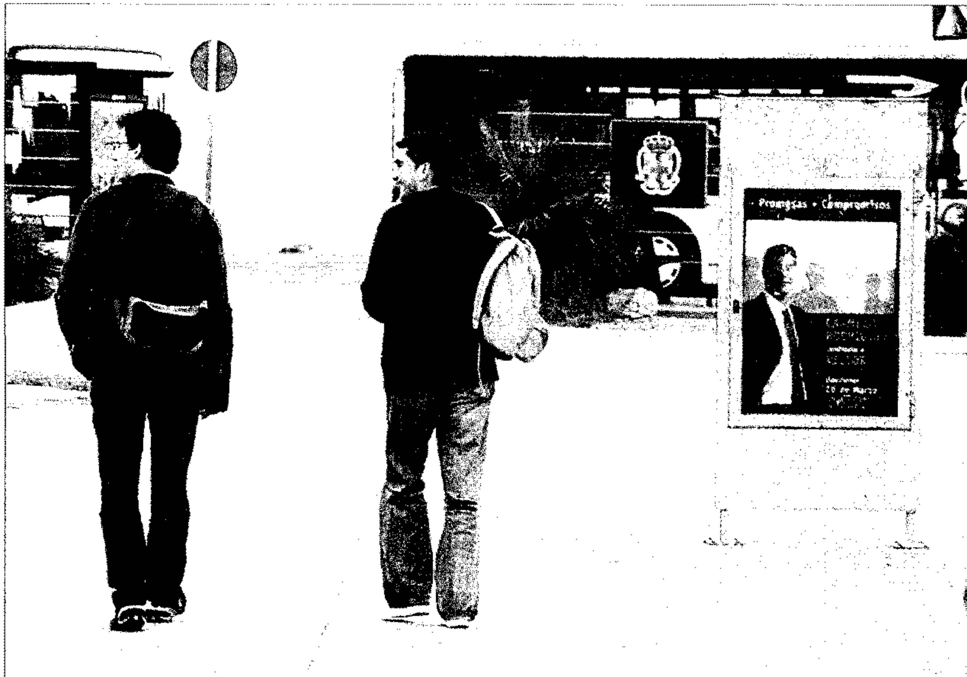
Dos universitarios caminan, ayer, hacia la parada del autobús del campus universitario.