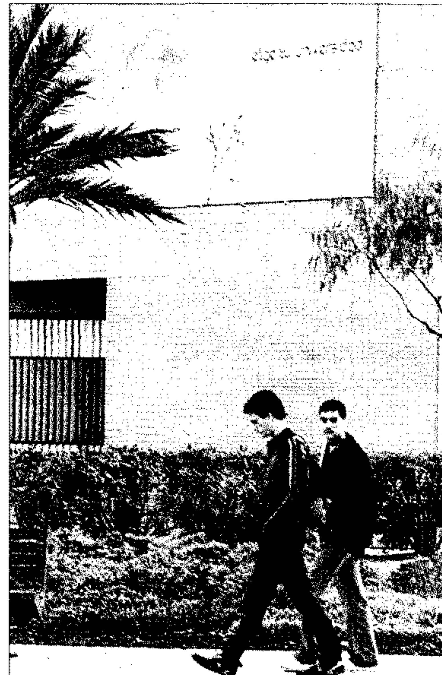
Cartel informativo sobre las elecciones.