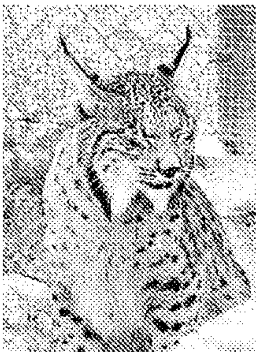
Un lince ibérico.