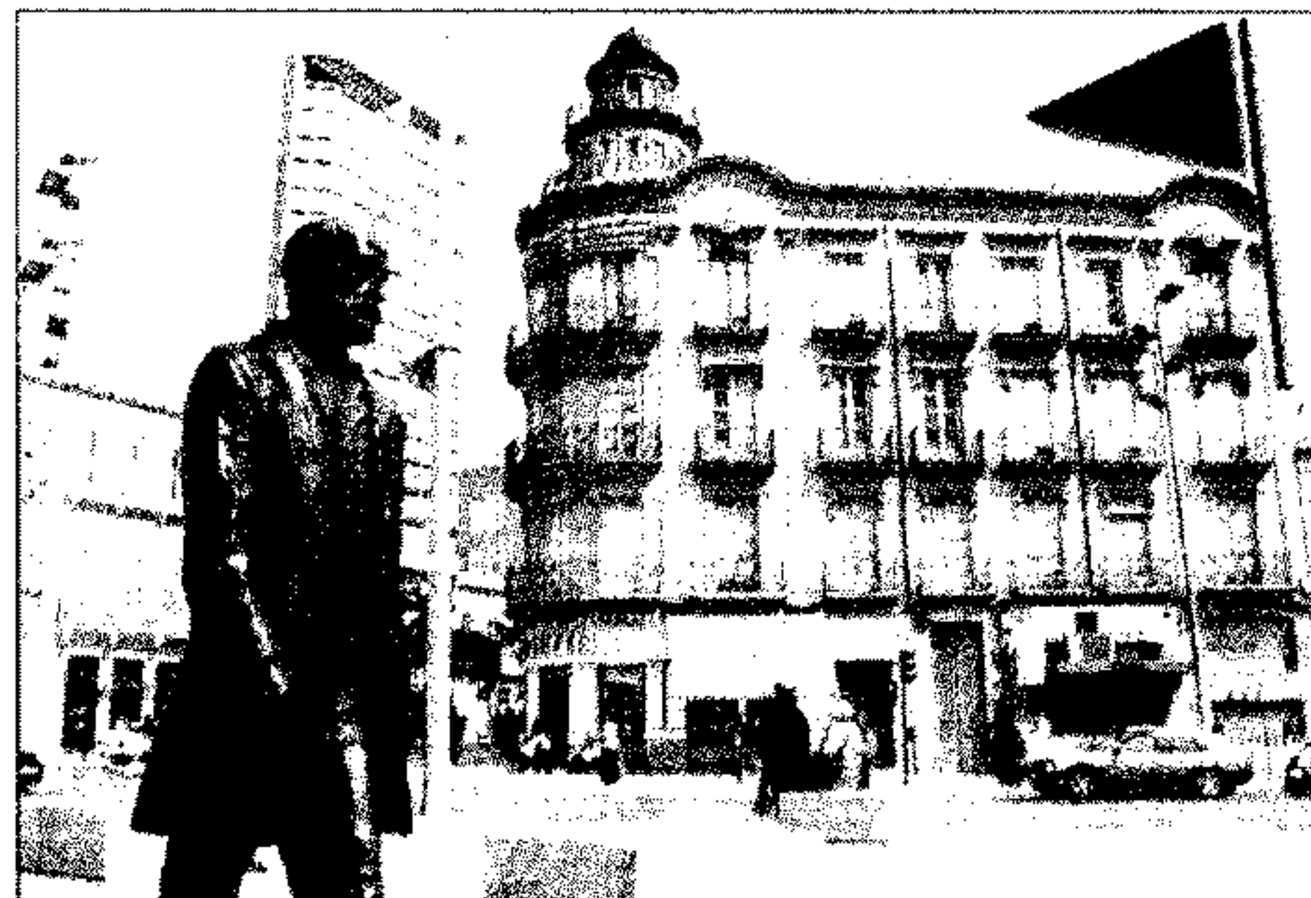
MARINA DEL MAR

PLAZA DE LA CONSTITUCIÓN. El oscuro símbolo representa la necesidad de un plan integral de protección y rehabilitación de su arquitectura monumental y tradicional extensible a todo el casco histórico.