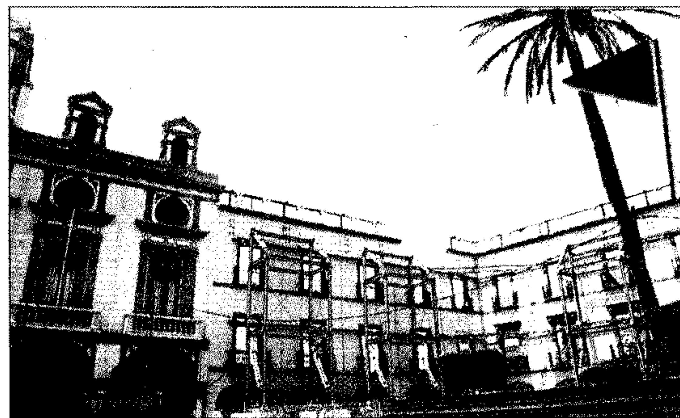
MARINA DEL MAR

LA ALCAZABA. Será la primera bandera en ubicarse por considerarse el monumento más emblemático de la ciudad y a la vez el que presenta el estado de deterioro más avanzado