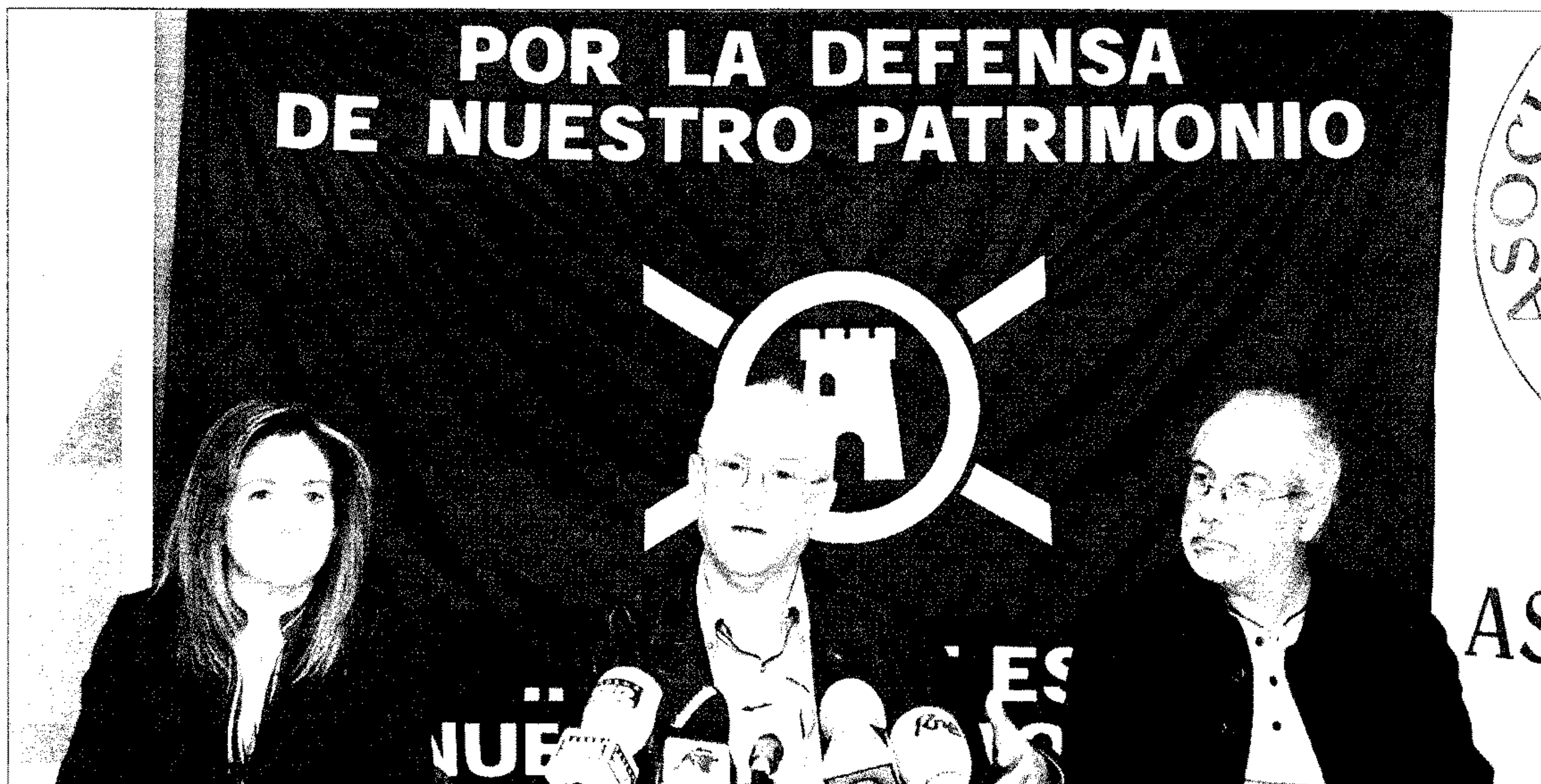
En el centro, el presidente de la Asociación Amigos de La Alcazaba, en compañía de miembros del colectivo, ayer durante el encuentro con los medios.