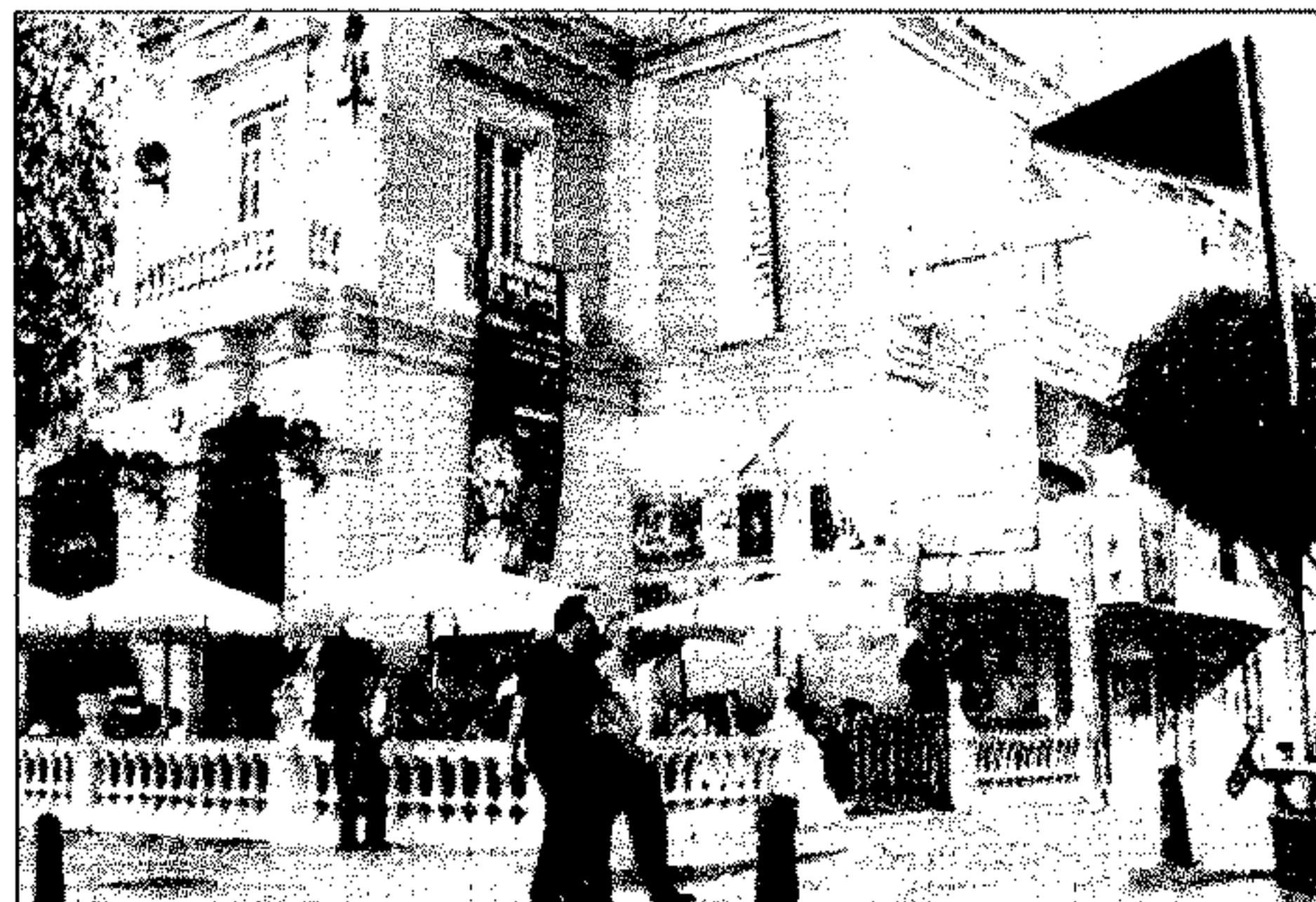
MARINA DEL MAR

PUERTA PURCHENA. El símbolo representa la destrucción del patrimonio histórico como consecuencia de la especulación urbanística que ha devorado a edificios singulares.