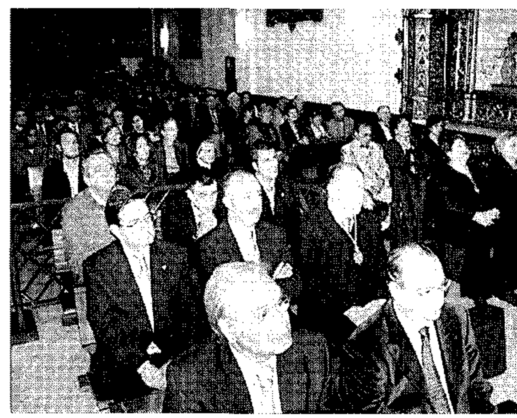
Rector, alcalde, y autoridades académicas y cofrades. / J.M.Q.