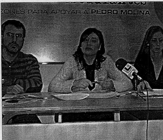
■ Tres miembros de la plataforma explicaban ayer los contenidos del periódico.

El oponente de Molina en las elecciones del próximo 26 de marzo sigue una estrategia diferente y, desde hace semanas, se reúne con políticos y responsables de entidades almerienses con la intención de pre-