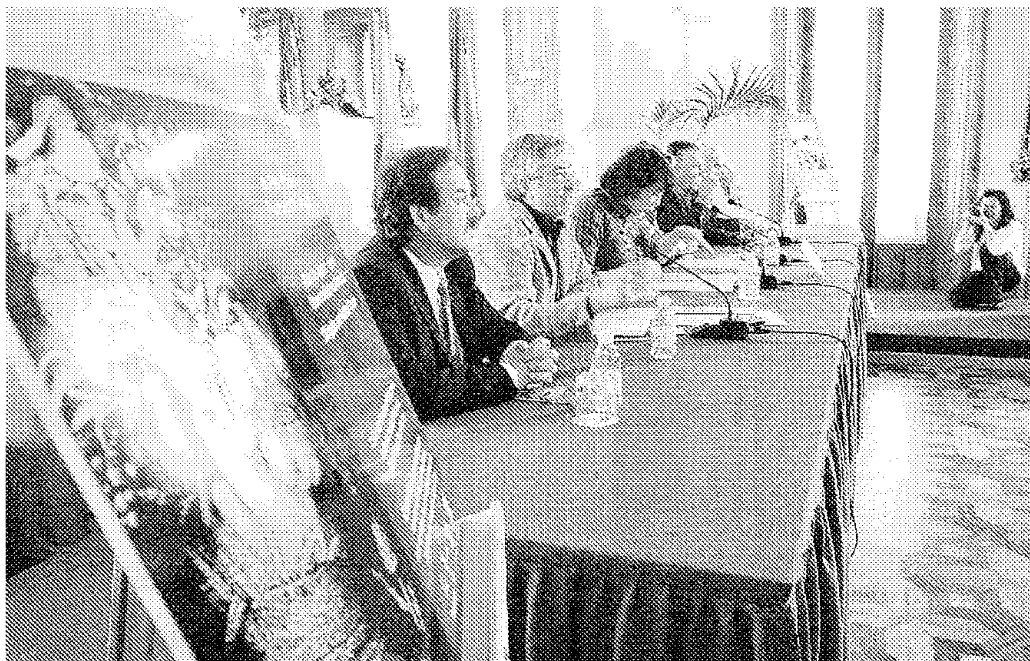
ESCÉNICA. Representantes de las instituciones organizadoras del festival en su presentación.

Esa posición queda también reflejada en el hecho de que la Compañía Nacional de Teatro Clásico no solamente trae sus últimos montajes sino que organiza sus temporadas con Almagro y Almería como bases y como ejes. Este año lleva uno de sus espectáculos a un pueblo de la provincia, Vera, en estreno en Andalucía y prácticamente nacional. Y