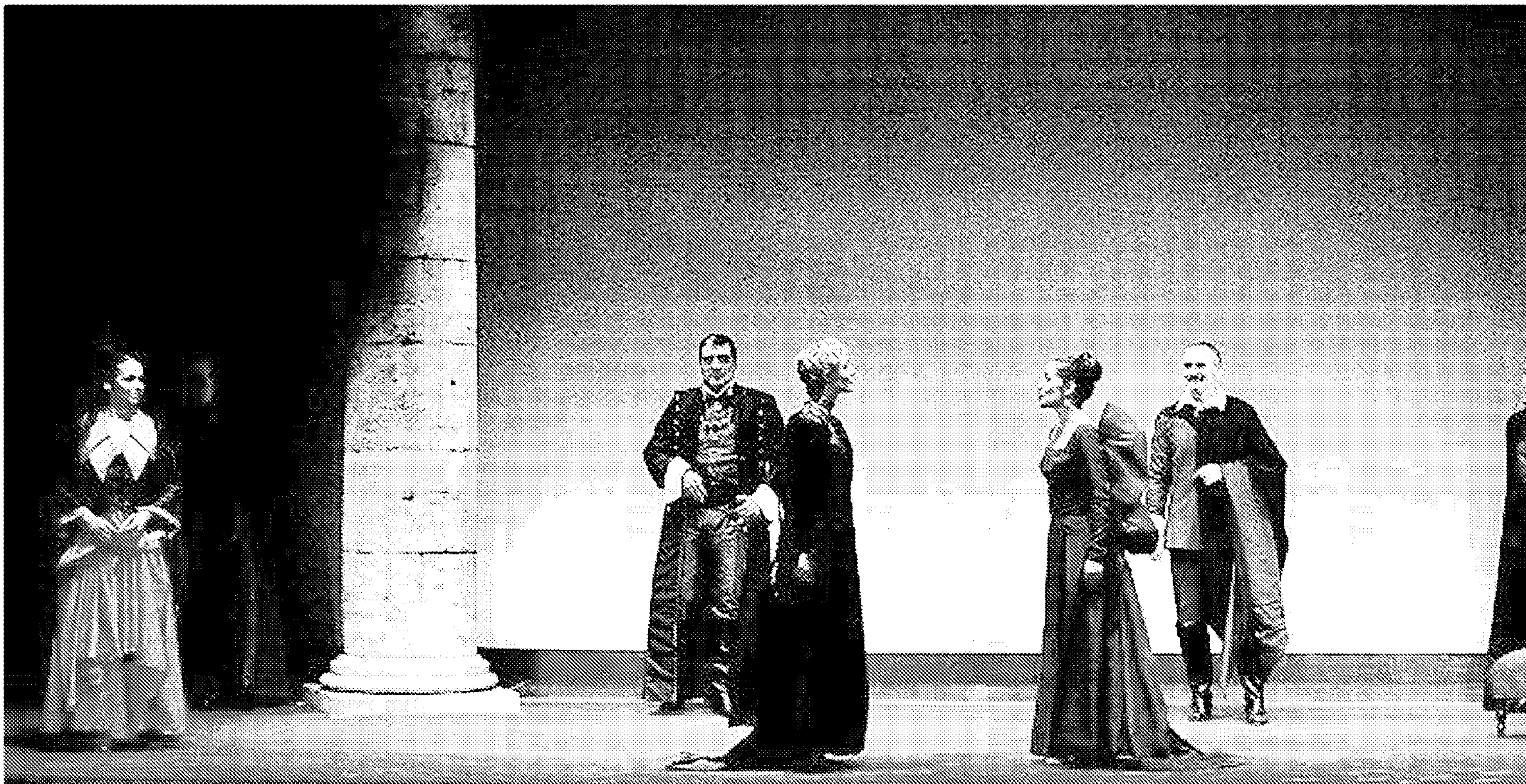
OTRAS EDICIONES. Escenas de la obra 'El castigo sin venganza', que se representó en Almería dentro de las XXI Jornadas de Teatro del Siglo de Oro.