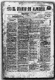
Solo un ejemplar. Aunque parece que tuvo una larga existencia, de "El Diario de Almería" solo se encontró un ejemplar, del año posterior a su nacimiento, 1878.