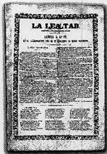
Uso de orlas. Se debía a hechos excepcionales: para resaltar el XXV Aniversario de la elección de Pío IX como Papa o el cumpleaños del turo Rey de España.