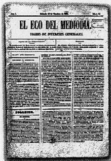
Conflictivo. La lucha entre algunos periódicos fue agria como "El Eco del mediodía" con su competidor, "La Crónica Meridional". El Eco nace en 1864.