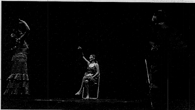
Tres mujeres diferentes, pero con algo en común: su intensa vida, protagonizan 'La calle del infierno'.

Antonio Onetti (Sevilla, 1962) es el autor de esta obra en que se entremezclan con maestría la comedia y drama. En ella quiso tejer «un tapiz donde se van hilvanando los hilos que mueven a las personas de destino incierto». Y eso es lo que se describe en escena: lo miserable del ser humano, la capacidad de sufrir de muchas personas e, incluso, la capacidad para hacer daño de otras. Pero todo se