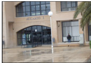
Universidad de Almería

Ruiz ha trasladado, por otra parte, el malestar existente entre los comerciantes de la zona por las obras del bulevar de la carretera de Níjar y las molestias que les están causando. "Sobre todo, teniendo en cuenta los antecedentes de los problemas vividos antes por los comerciantes del barrio de El Alquíán", señala el andalucista.