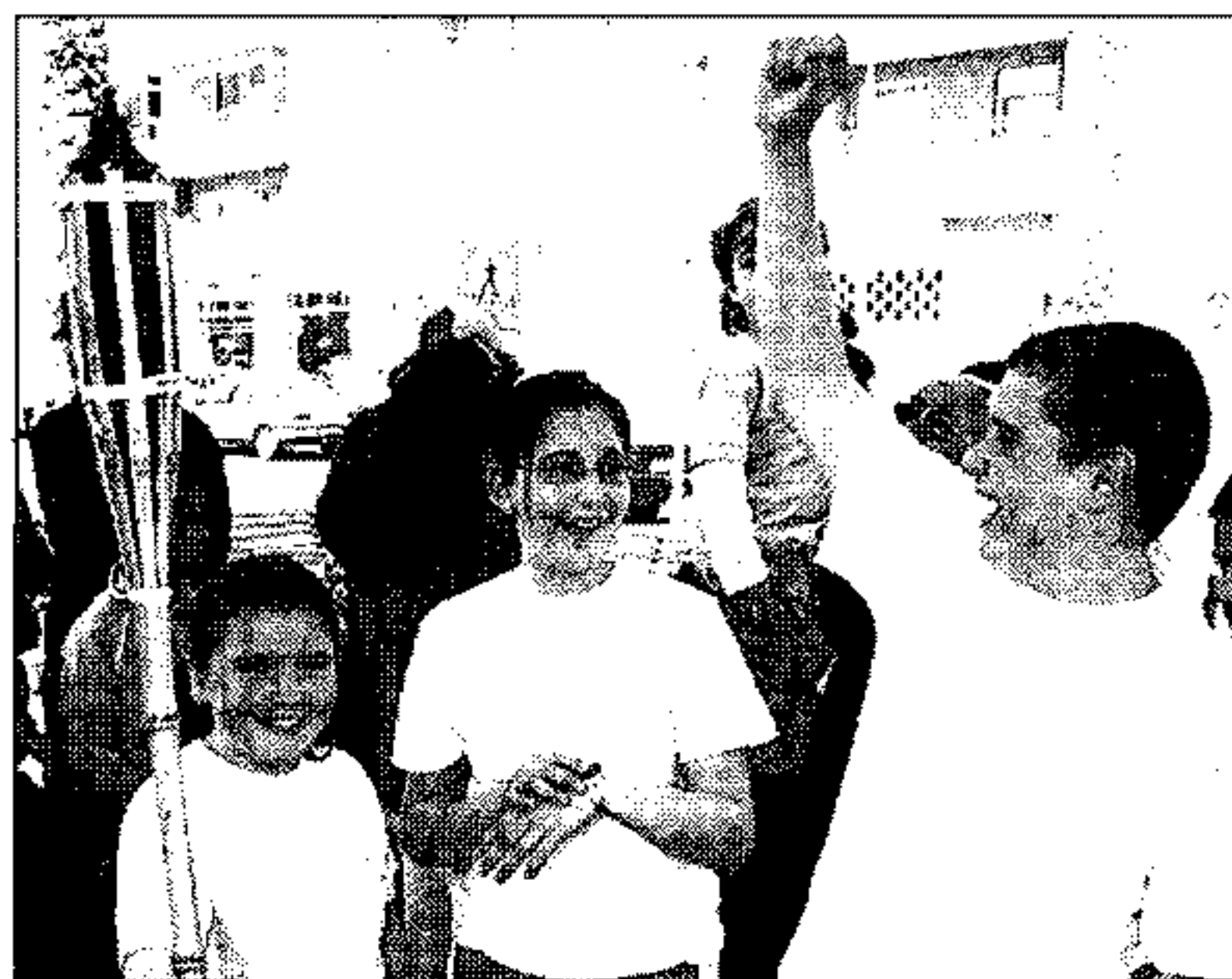
Escolares del municipio vicario junto a la antorcha.

han sido los encargados de dar a conocer los pormenores de esta iniciativa que a lo largo de las distintas ediciones celebradas ha obtenido el reconocimiento de las administraciones por su contribución al fomento de la lectura.