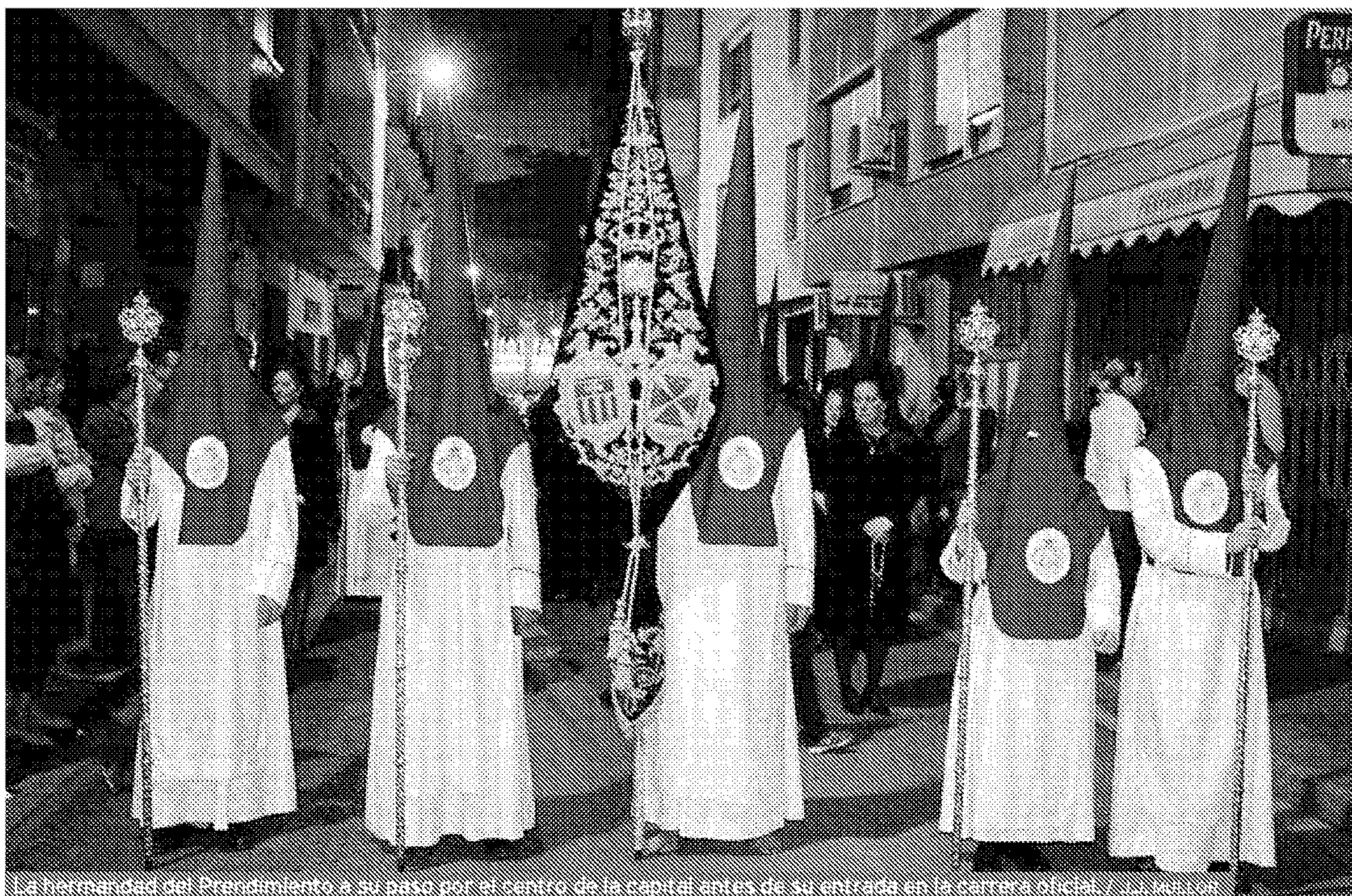
La hermandad del Prendimiento a su paso por el centro de la capital antes de su entrada en la carrera oficial.