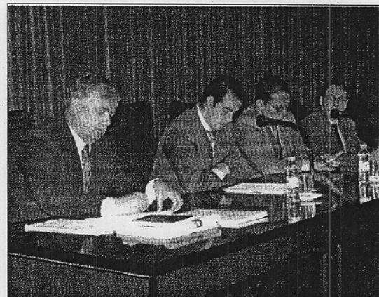
Momento de la presentación de la jornada sobre reforma de los estatutos

Para él las reformas actuales vienen a "corregir cosas que no se habían hecho bien, mejorar y perfeccionar". También pretenden actualizar los estatutos de comunidades que nunca antes lo habían reformado. Otros expertos también mostraron sus puntos de vista sobre las reformas actuales.