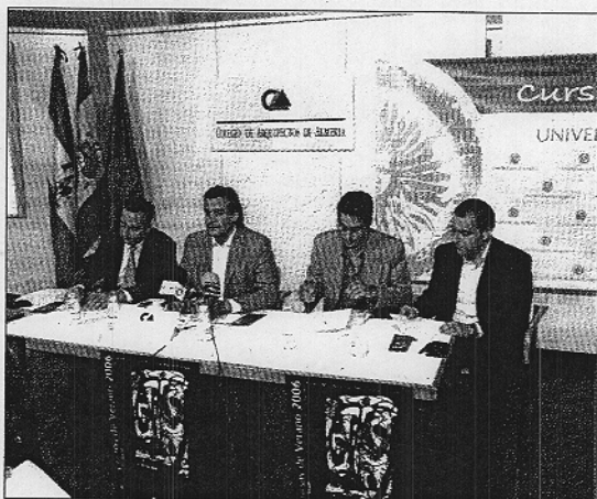
Presentación del curso de verano en el Colegio de Arquitectos