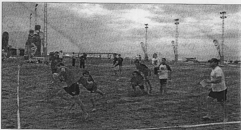
Un grupo de jugadores de los que participaron en el torneo de Primavera, concretamente en Rugby