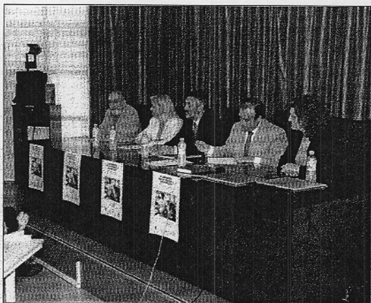
Inauguración de las "III jornadas de voluntariado y desarrollo"