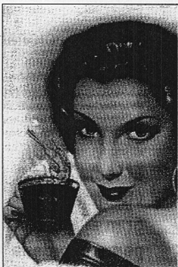
Señora tomándose un café

jó fueron treinta voluntarios consumidores de entre tres y siete cafés al día, que durante nueve meses se han medido los niveles de colesterol total, colesterol LDL (colesterol malo), colesterol HDL (colesterol bueno) y triglicéridos cada quince días. Los resultados obtenidos indicaron una línea estable, que significa que bajo