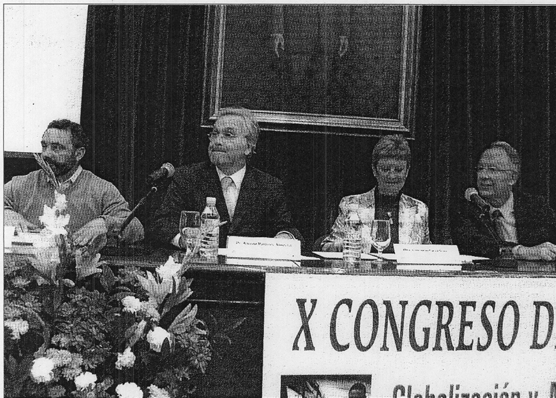
El director de las jornadas junto al Rector de la Universidad, la secretaria de Estado de Inmigración y el delegado de la Junta de Andalucía