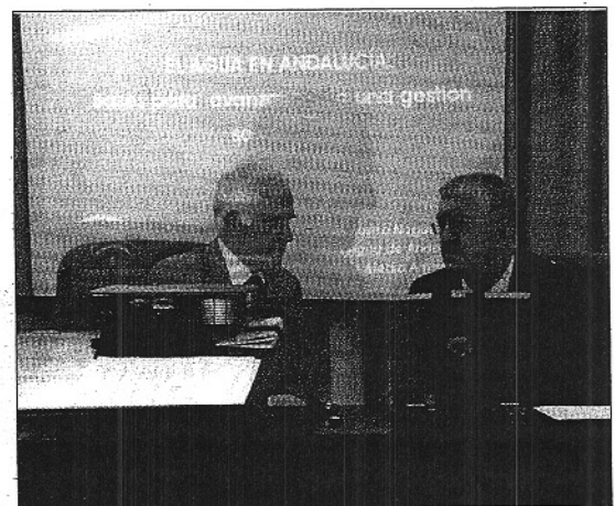
Imagen de la inauguración del curso "El agua y medio ambiente"

El tema del agua se ha convertido en un debate a nivel mundial ya que las reservas con las que