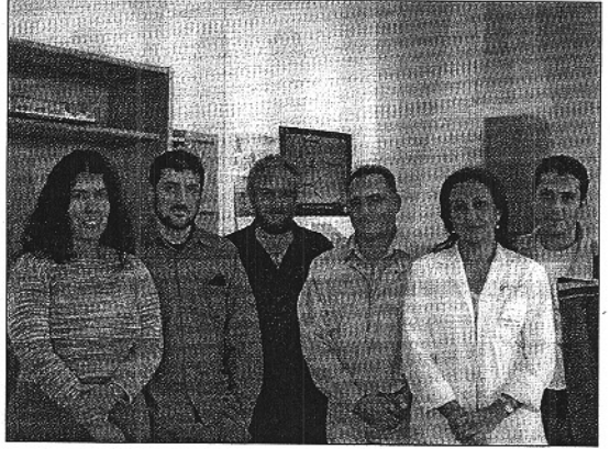
Imagen del grupo de personas que trabaja en prevención de riesgos