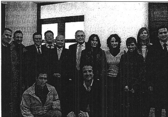
Acto de Presentación de las Actividades Desortijas en la UAL

Durante el primer trimestre del curso académico se realizó el primer módulo, sobre Finanzas, y en estos días ha finalizado el segundo módulo, dedicado al perfecciona-