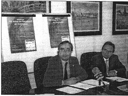
Presentación del seminario "150 años de ferrocarriles en Andalucía"

Los textos que se presentaron van a ser compilados para la edición de un libro que recogerá el