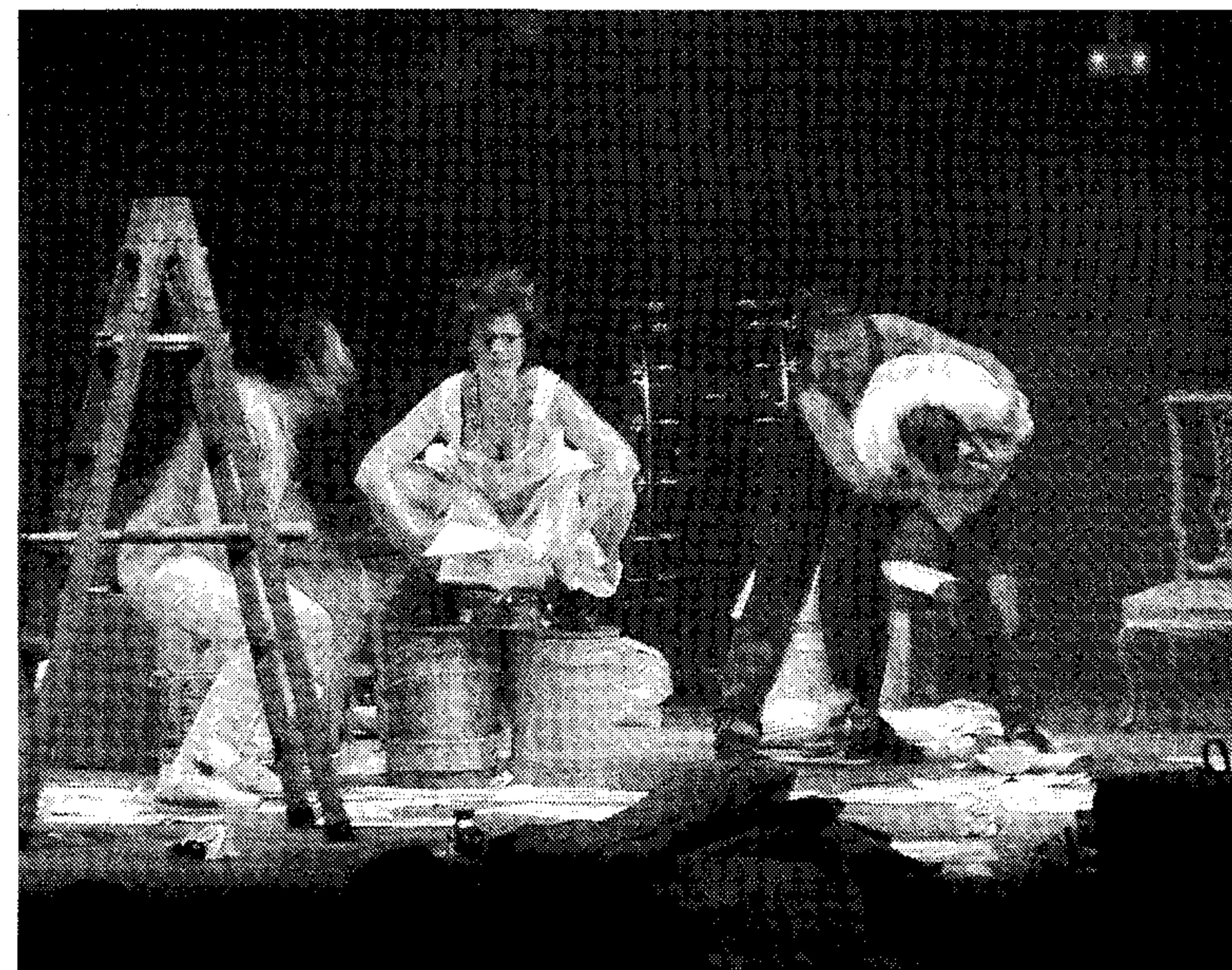
OBRA. Representación del Aula de Teatro.

El Aula de Teatro transitará con maestría entre el drama y la comedia en este texto escrito por Antonio Onetti, que ya ha representado en diferentes escenarios de la capital y la provincia con gran éxito.