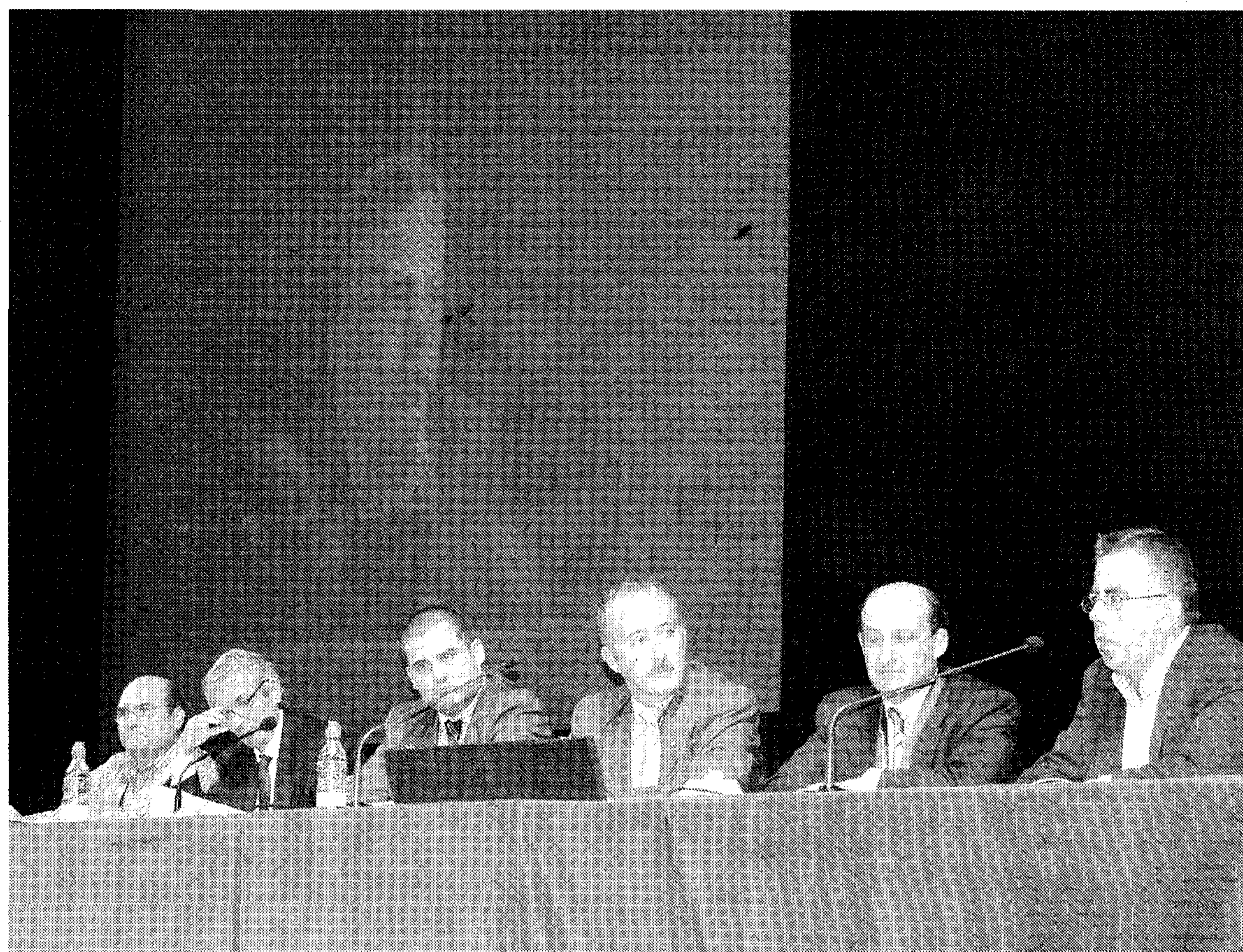
FIN. Acto de clausura del Congreso Internacional celebrado hasta el 28 de octubre.

La obra teje un tapiz donde se van hilvanando los hilos que mueven a las personas de destino incierto. Se describe lo miserable del ser humano, la capacidad de sufrir de muchas personas e,