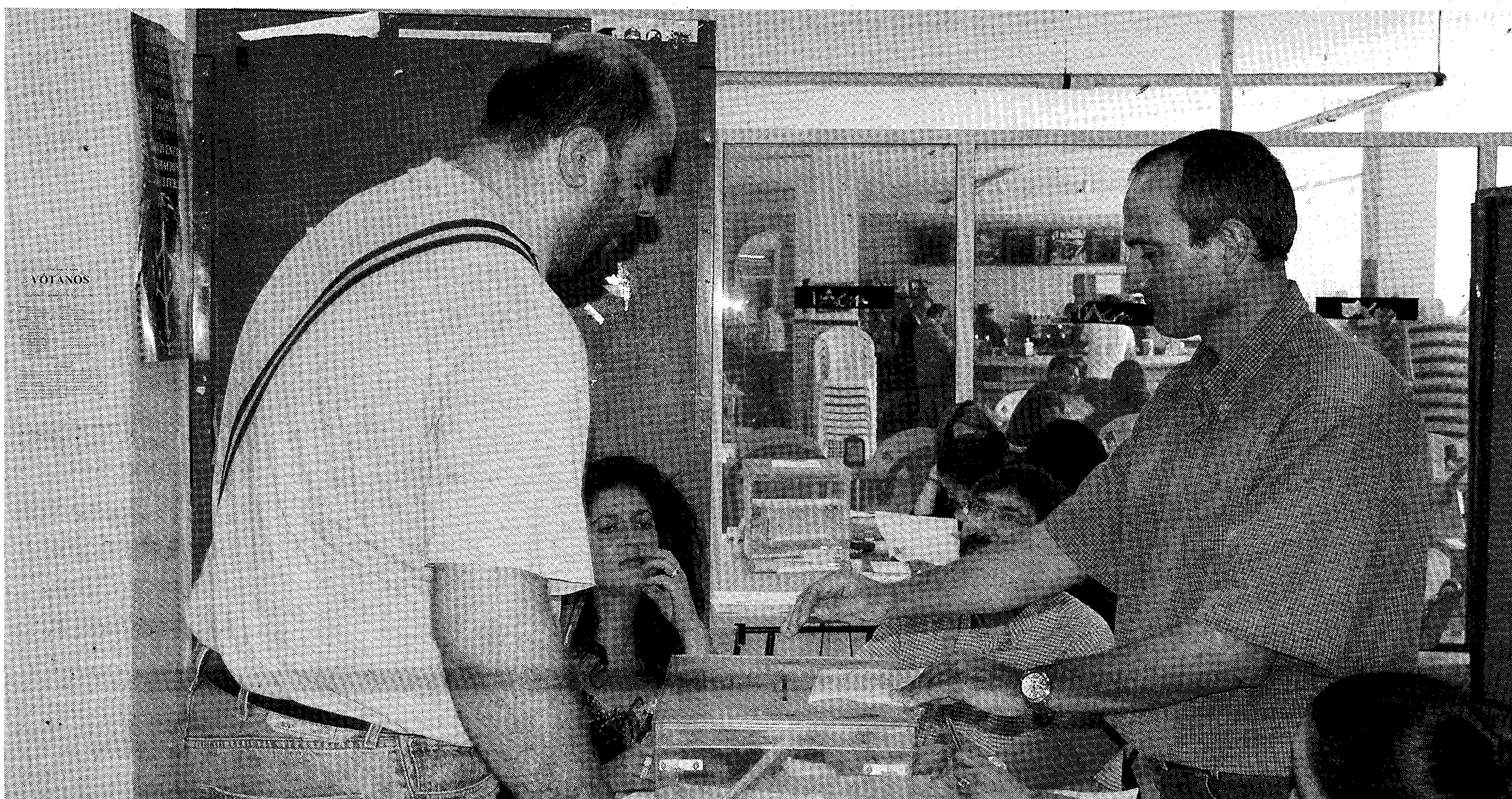
CENTRAL. Un miembro del PAS deposita su voto en la jornada de mañana.