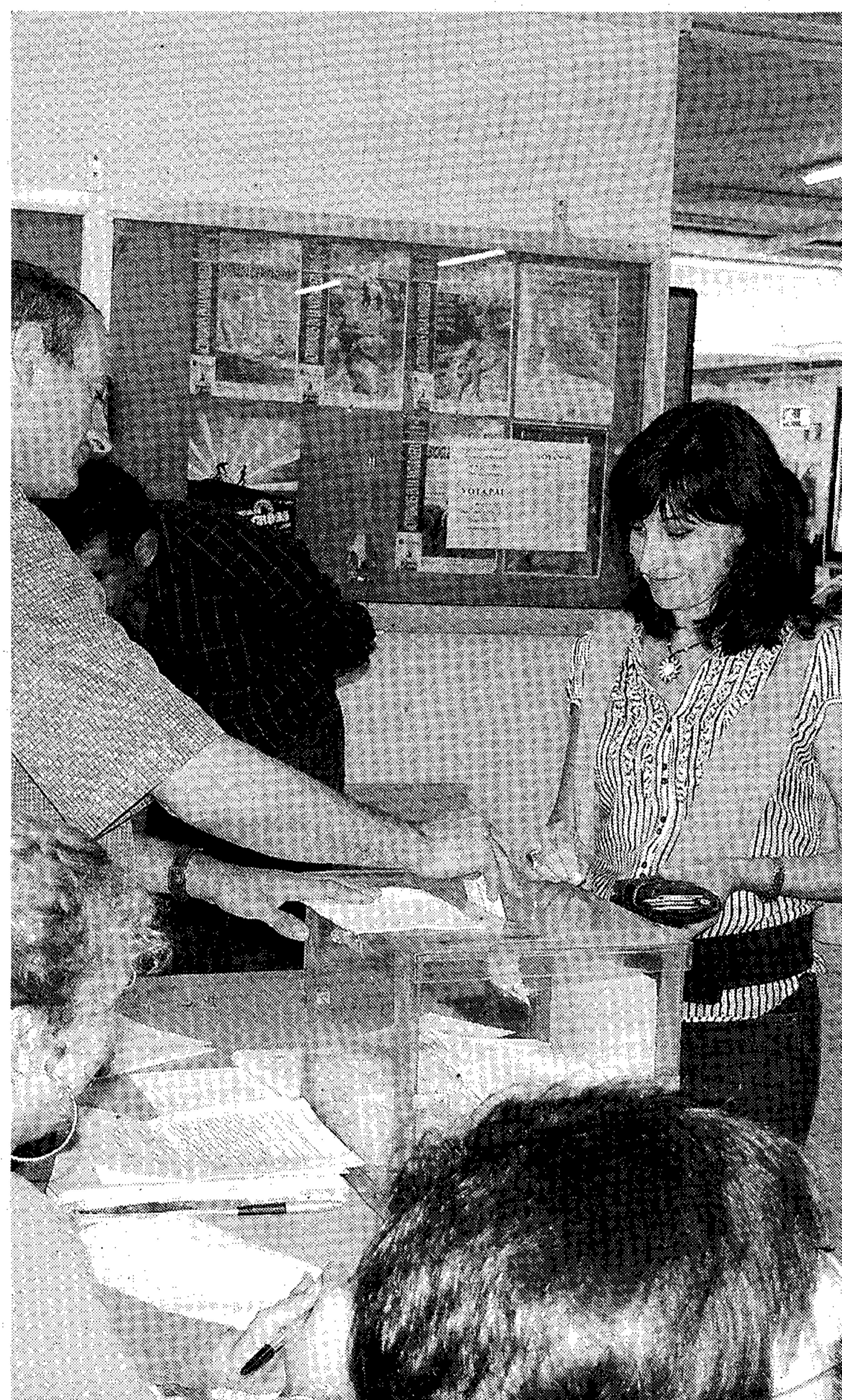
PAPELETA. Una trabajadora del PAS recoge el voto.

Todavía habrá que esperar, ya que el proceso electoral a Rectorado es bien distinto y estos resultados no son más que una posible pista de cómo se sucederán las cosas. Aunque el PDI se ha mostrado favorable a Pedro Molina, las tornas pueden cambiar y tampoco se conoce qué votará el PAS y alumnado. Todo está por ver.