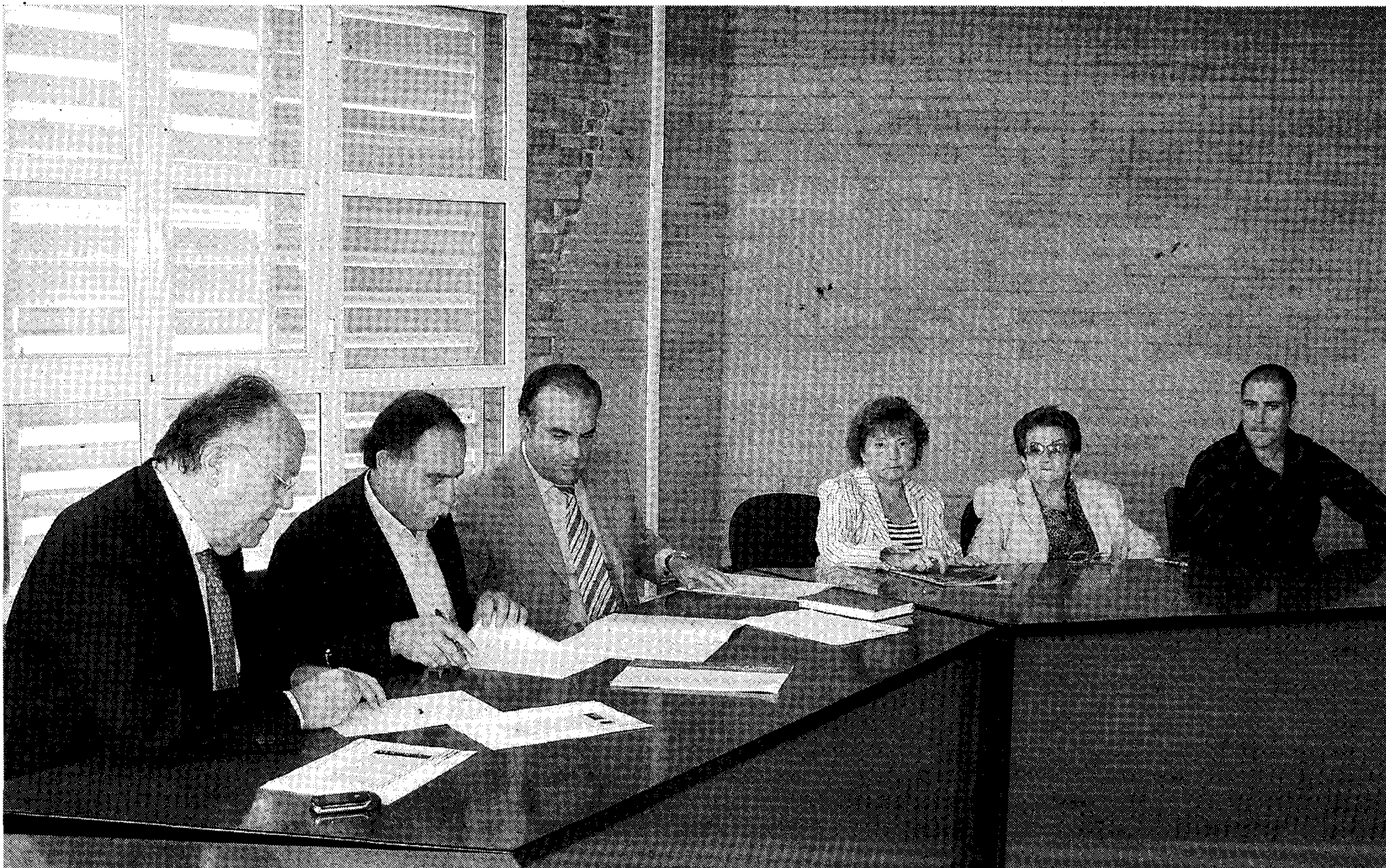
PARTICIPANTES. Acto de presentación del programa y firma de compromisos por las partes.