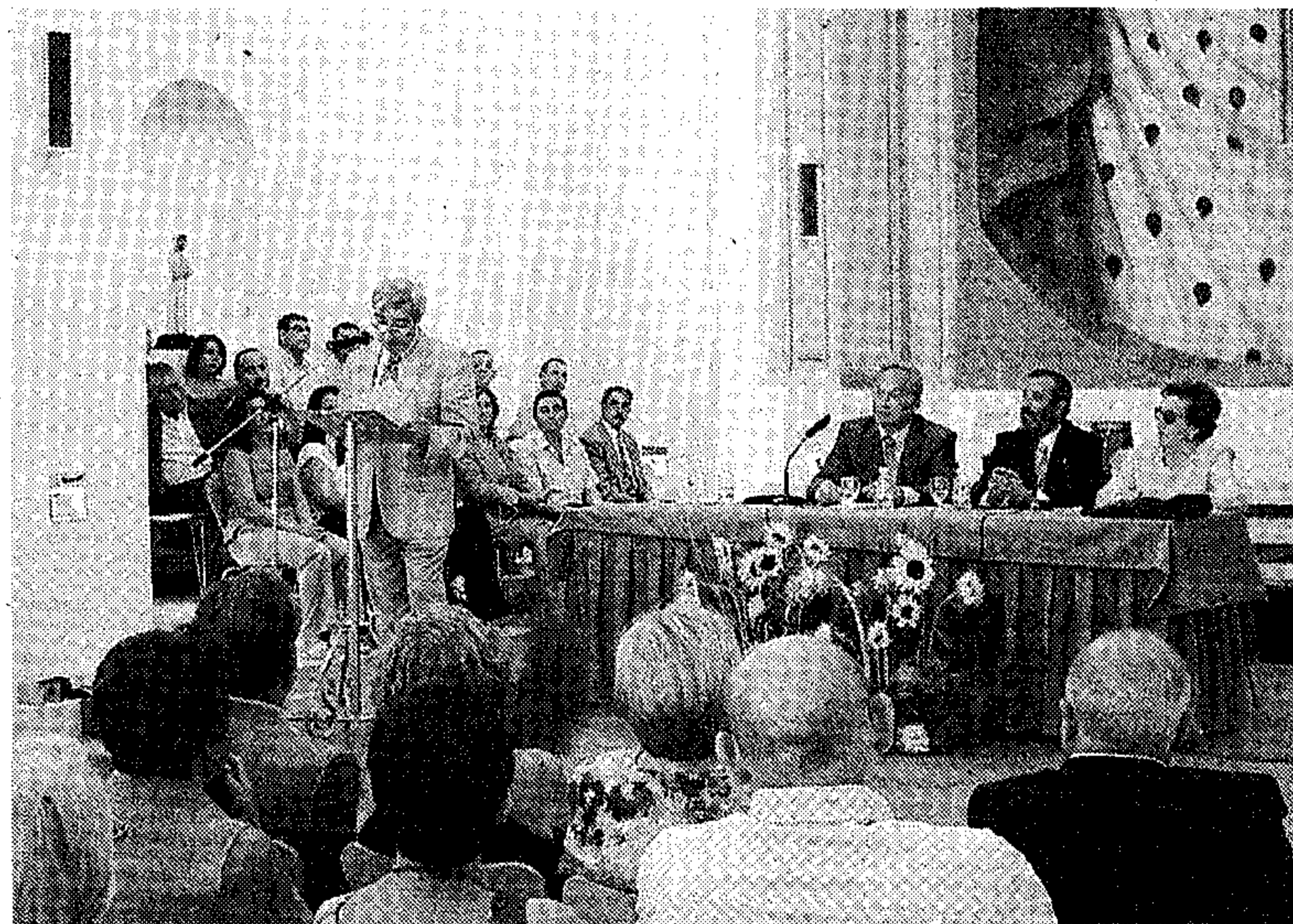
MAYORES. Programa fruto de un convenio similar.

Aunque actualmente, en lo que llevamos de curso, sólo hay siete