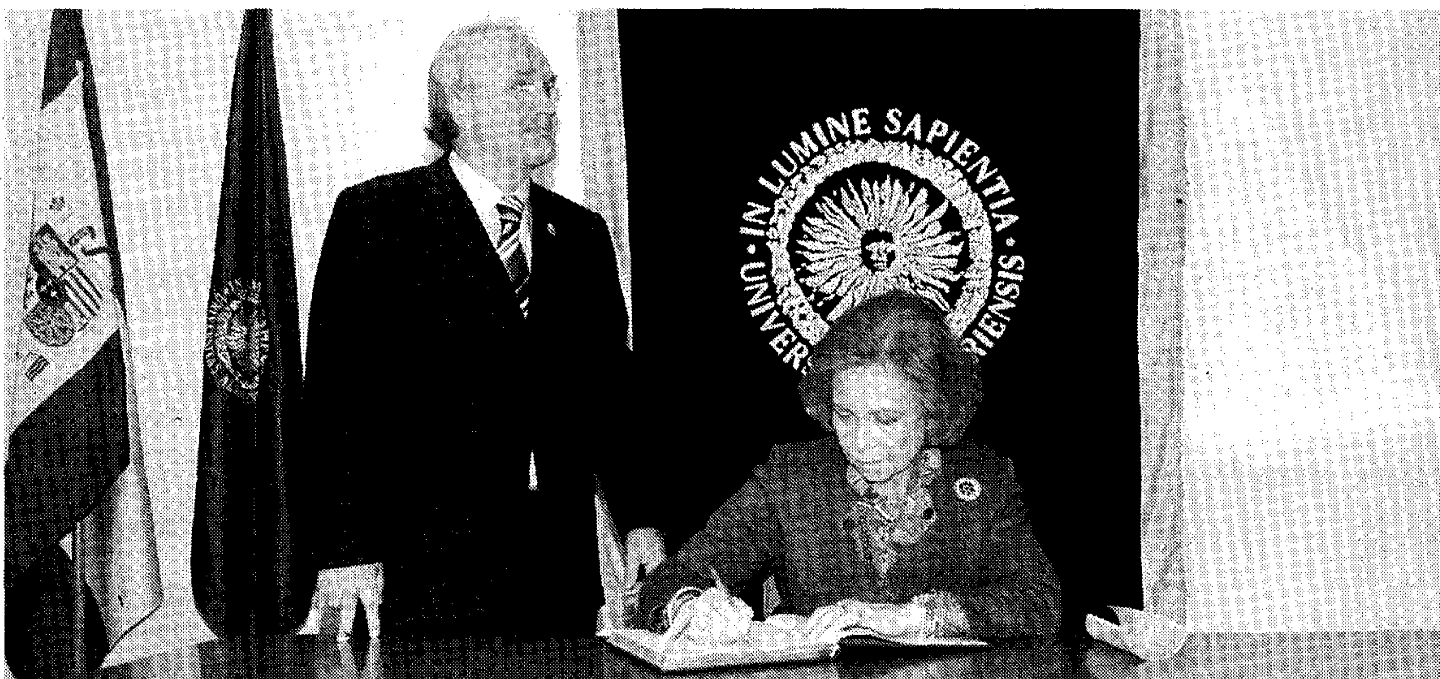
RECUERDO. S.M. la Reina doña Sofía firma el libro de la Universidad de Almería.

Como propuestas concretas, los expertos reunidos en el II Simposio Internacional sobre el tema