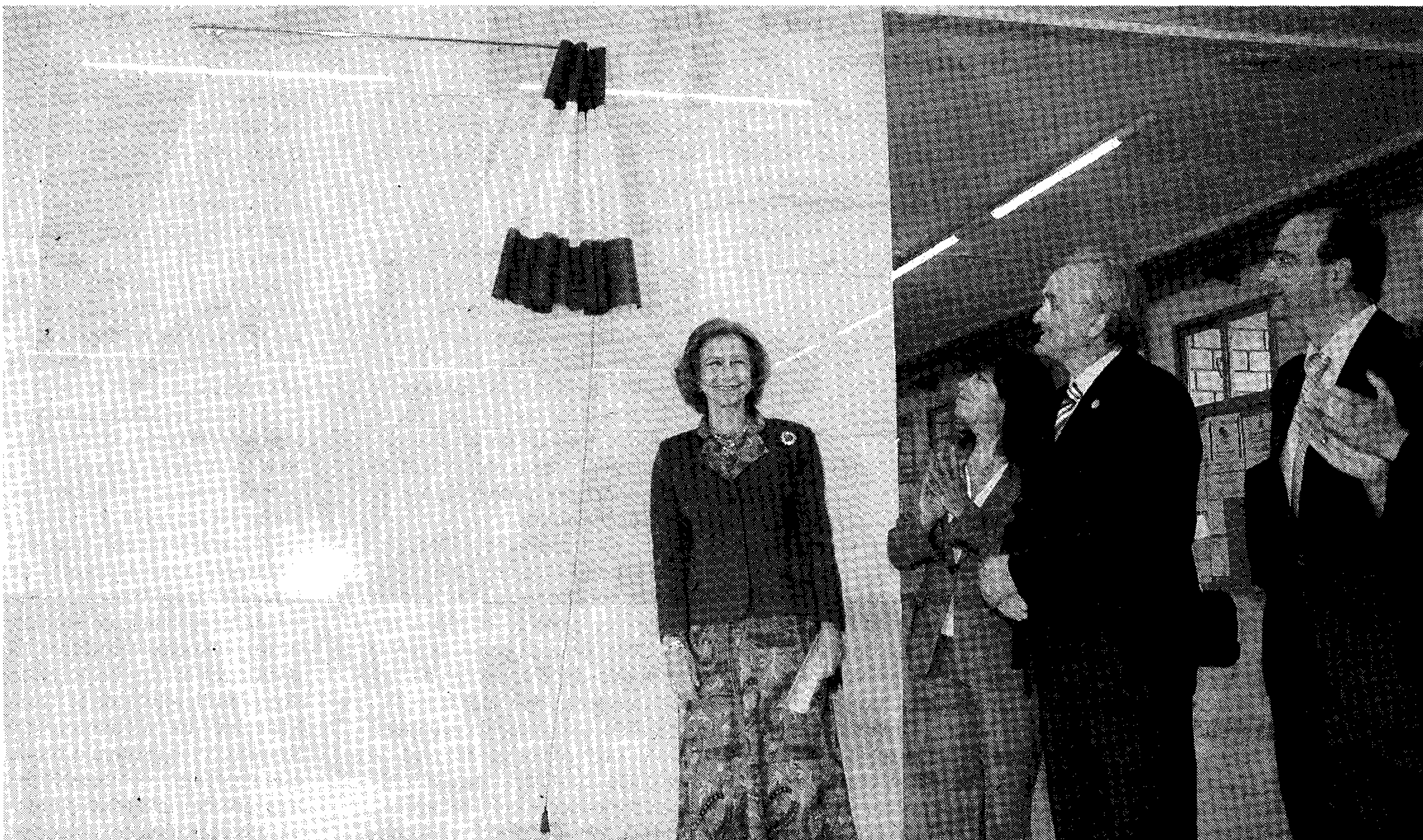
EDIFICIO CENTRAL. S.M. la Reina doña Sofía descubre una placa como recuerdo de su visita a la UAL.