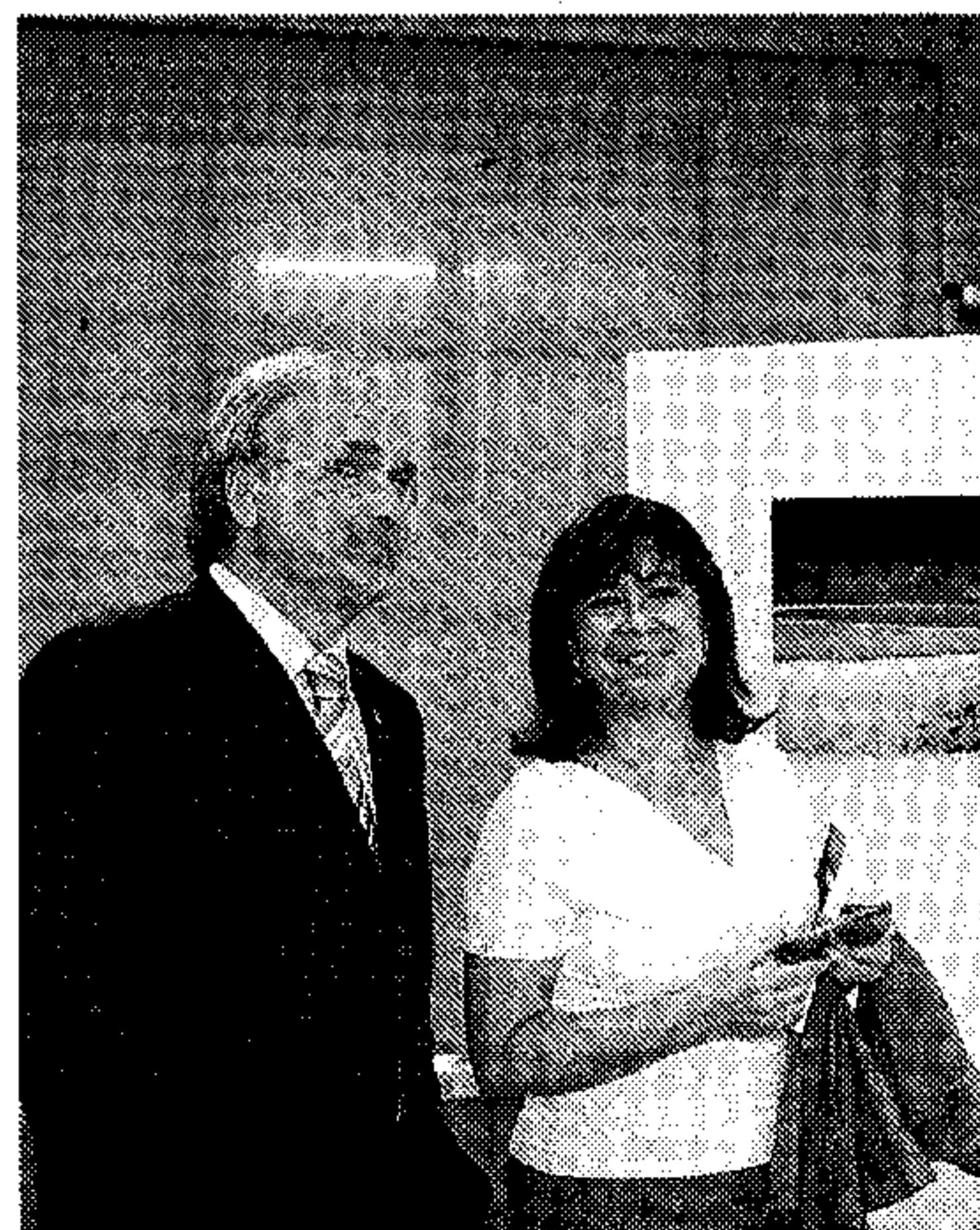
MUESTRA. Un instante.

Durante los días de celebración del Simposio se ha exhibido en la Sala Bioclimática de la UAL una exposición de fotografías sobre los desiertos, preparada por la Secretaría de la CNULD. La Agencia Española de Cooperación Internacional expuso sus actividades en materia de lucha contra la desertificación. El Grupo Tragsa también mostró sus experiencias.