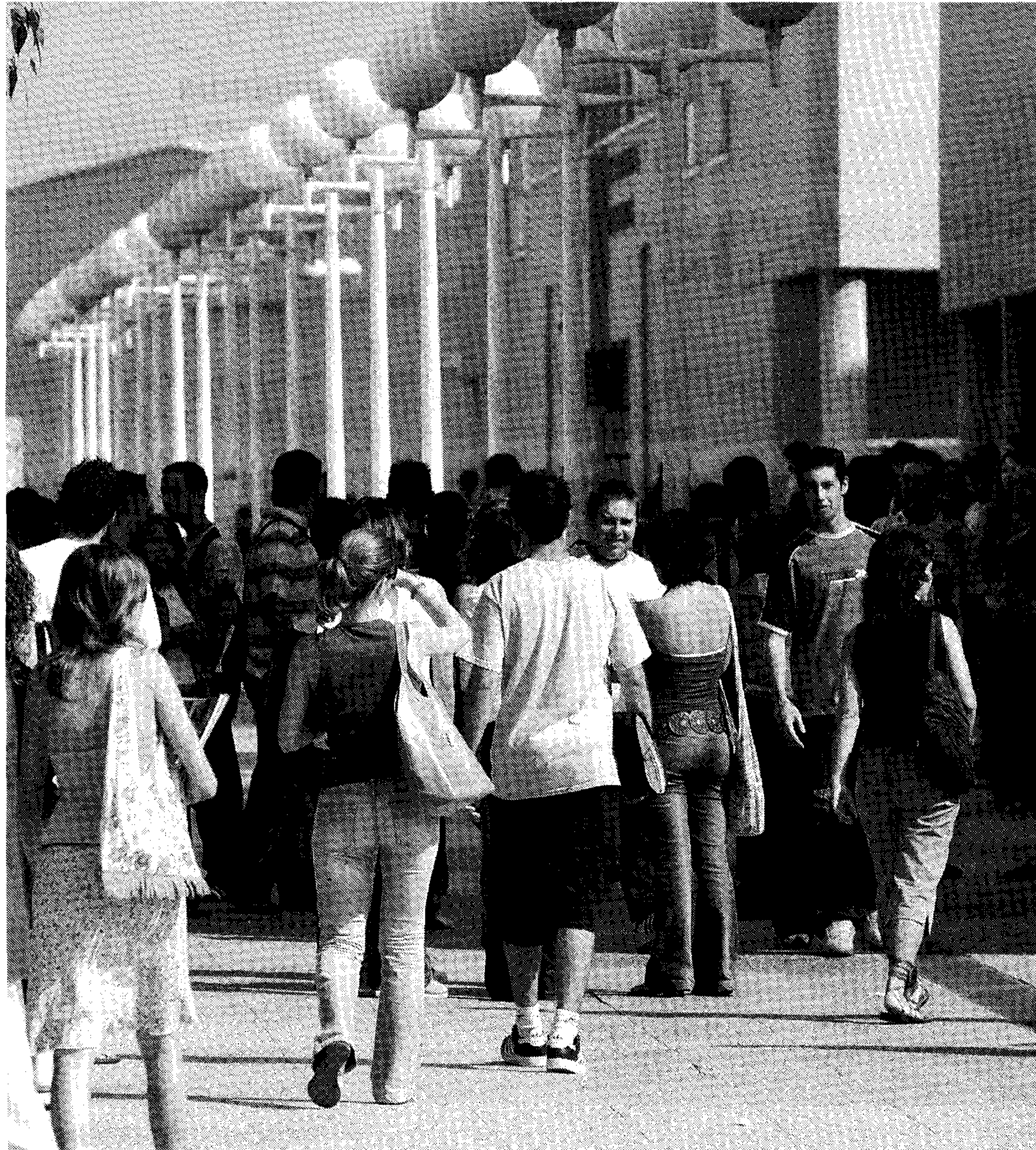
ENCUESTADOS. Estudiantes almerienses en el Campus de La Cañada.

De estos bloques evaluados, el que ha obtenido la máxima calificación ha sido el de la relación profesor-alumno, valorado con un 4,08 sobre 5. Este apartado fue también el que salió mejor parado en evaluaciones anteriores. En concreto, los alumnos han valorado con un 4,31 el respeto, y con un 4,20 la igualdad en el trato. El cumplimiento de las obligaciones docentes es el segundo bloque que ha obtenido mejor calificación, un 4,03 sobre 5. Según el estudio, dar clase los días establecidos en el horario es el aspecto mejor valorado en este sentido, con un 4,37. Sin embargo, en el 45,7% de los cuestionarios el alumnado no contesta a la hora de valorar el comportamiento del profesorado en las tutorías. A la pregunta «cuando asistes a sus tutorías en el horario establecido, te atiende adecuadamente», los alumnos han calificado con una nota de 4,13.