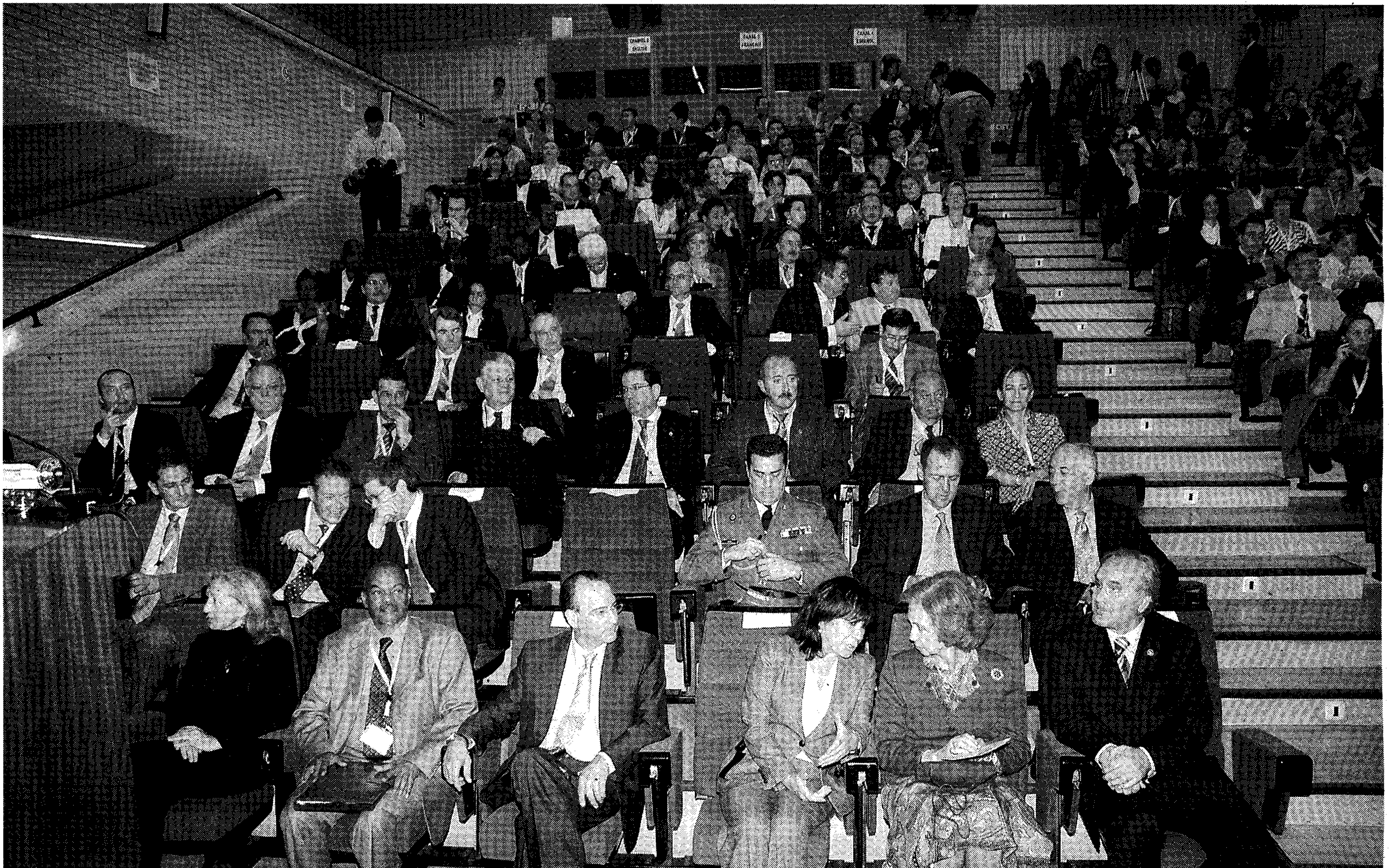
INAUGURACIÓN. S.M. la Reina doña Sofía inauguró el Simposio en el Auditorio Universitario, junto con otras autoridades competentes.