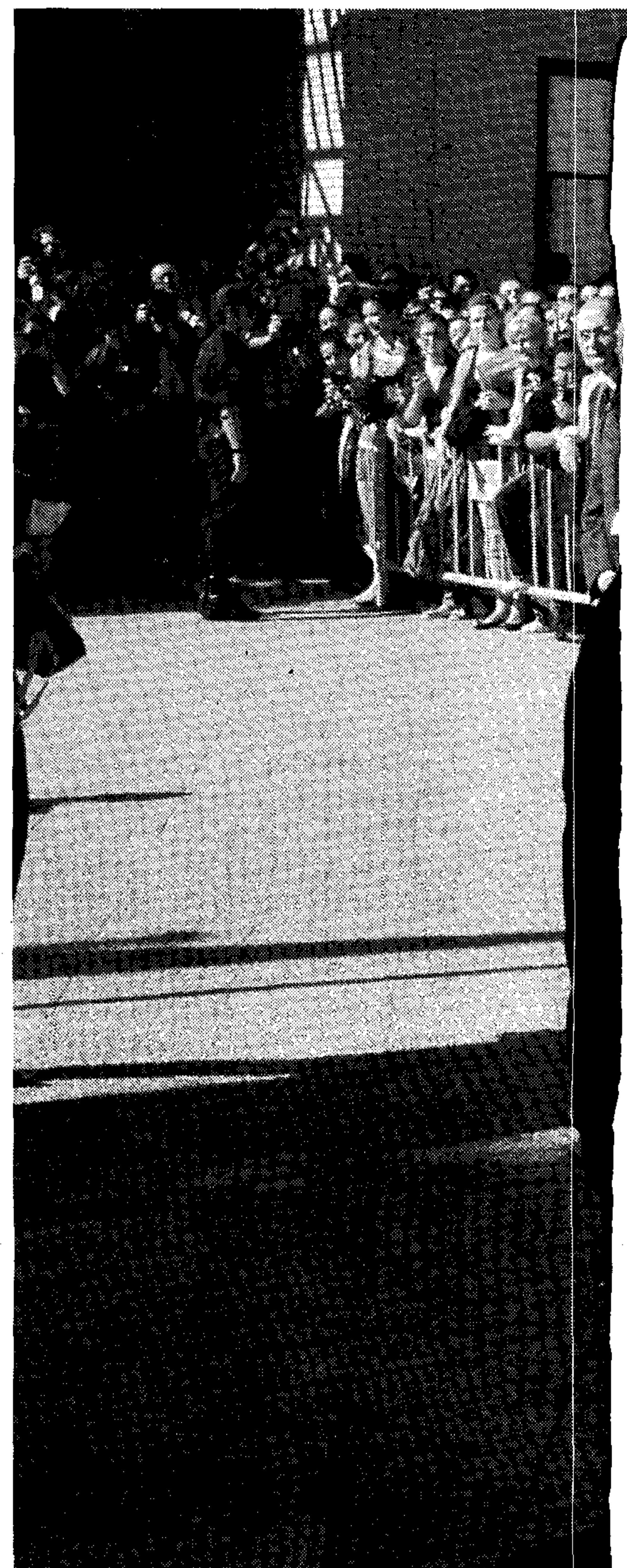
SALUDOS. S. M. la Reina doña

Según expertos, el modelo almeriense es un ejemplo de lucha y alternativa