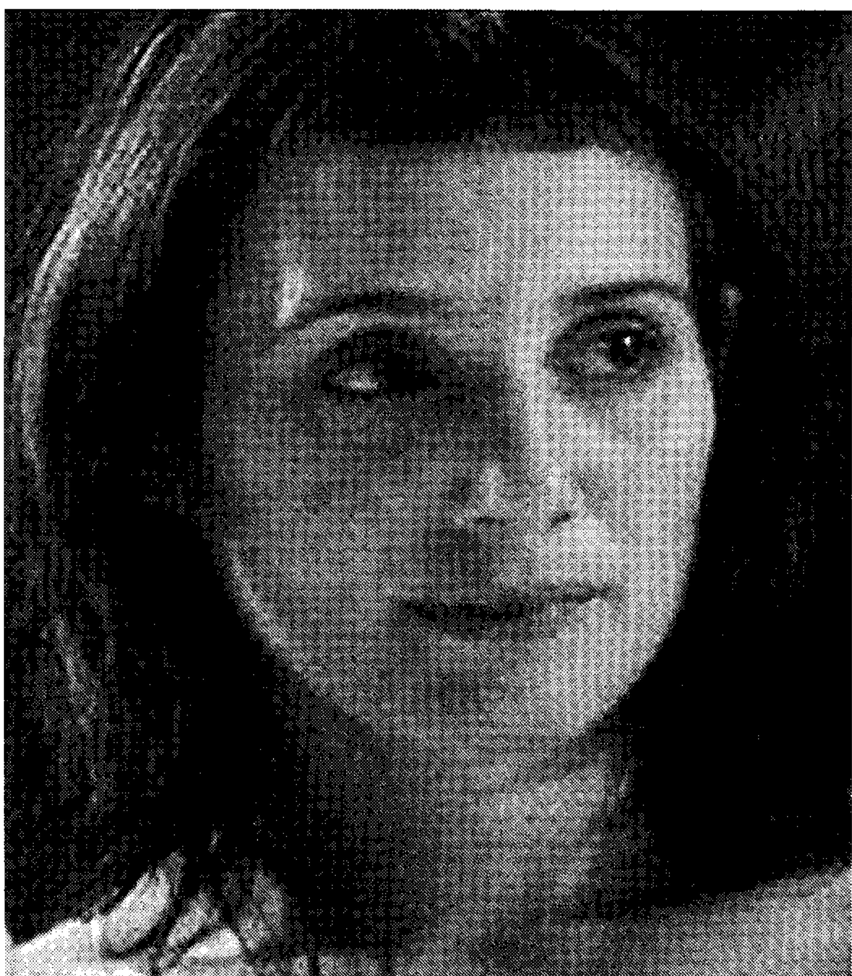
ESCENA. Película que se proyecta hoy en el Apolo. /IDEAL