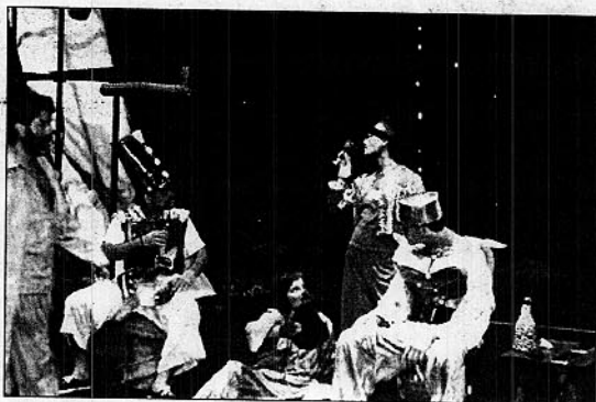
Una de las actuaciones del Aula de Teatro