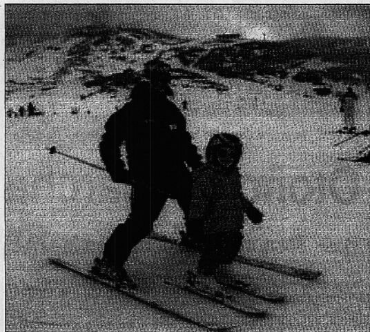
Imagen de un niño aprendiendo a esquiar en Sierra Nevada

vicios, Sierra Nevada se dota día a día con las últimas infraestructuras, tanto para el esquí como para el tiempo que se pasa fuera de las pistas.