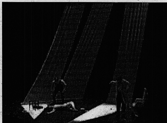
Imagen de una actuación de los alumnos de teatro de la Universidad

También para más información se puede llamar al teléfono: 950