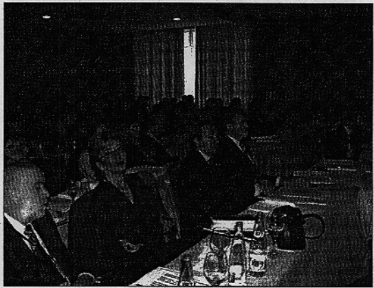
Imagen del encuentro sobre la formación del profesorado