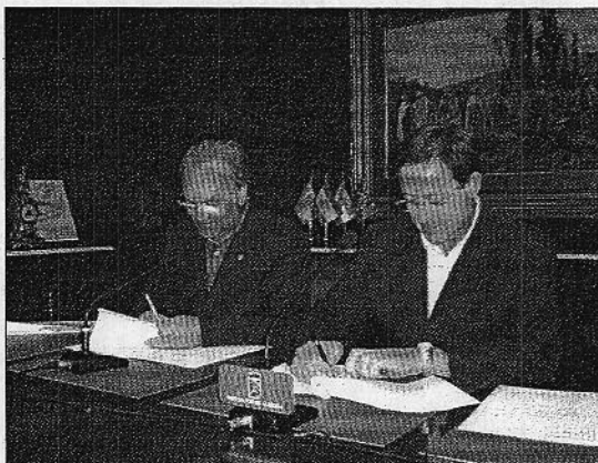
El Rector y el Vicepresidente de Diputación, ayer durante la firma

En concreto, como advierte el documento rubricado ayer, el objeto del convenio es "la realización de