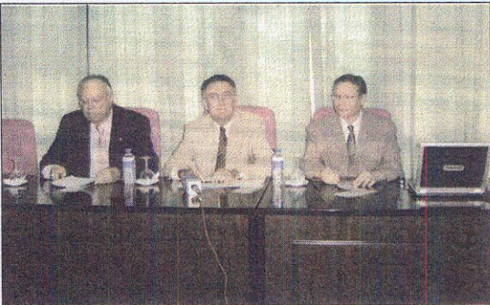
Acto de presentación del Programa Empléatec en la UAL

Innovación, Tecnología y Empresa, reclamó mayor participación de la iniciativa privada para la dinamización del sistema de I+D+i en Andalucía, así como un mayor acercamiento de las instituciones públicas y la creación de empresas de base tecnológica.