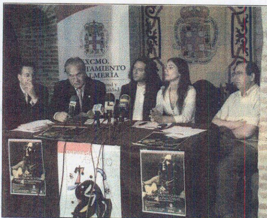
Momento de la presentación del curso de verano 'Bajandí'

■ FORMACIÓN DEL 11 AL 15 DE JULIO EN ALMERÍA