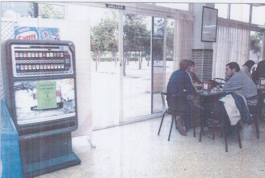
La Cafetería Central no ha sido catalogada como 'Espacio libre de humo' por lo que en ella se puede fumar, además de adquirir tabaco