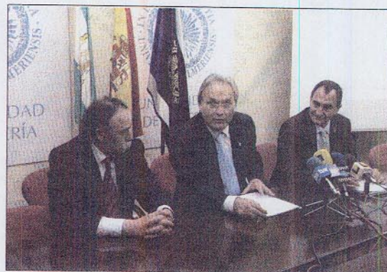
El Rector, junto al delegado de Igualdad y Bienestar Social

El convenio en el que se enmarca la iniciativa se articula en tres áreas. La primera es relativa a la investigación y se lleva a cabo a través de convocatorias de ayudas para proyectos de la UAL. Ya han sido seleccionados tres con un presupuesto total de 36.000 euros. La segunda