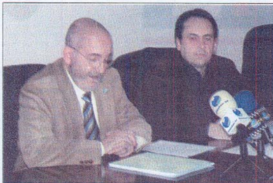
El decano y el vicedecano de la Facultad de Psicología

Por la tarde, se presentaron las líneas de investigación 'Efectos conductuales y cognitivos de los plaguicidas', 'Explorando un modelo conductual de impulsividad', 'Efectos neurocognitivos del abuso de las