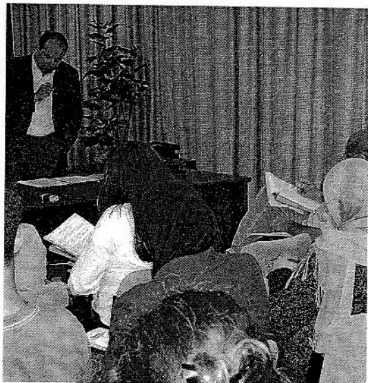
AULAS. Instalaciones del Centro de Lenguas.

pruebas recibirán un título que acreditativo de sus conocimientos de vocabulario y de las estructuras gramaticales más importantes de la lengua alemana. Los interesados en obtener más información pueden dirigirse al Centro de Lenguas de la UAL, ubicado en el Edificio Central del Campus de La Cañada, despacho 0.66, o llamar a los teléfonos 950 015 814 ó 950 015 998 o en el correo electrónico clenguas@ual.es .