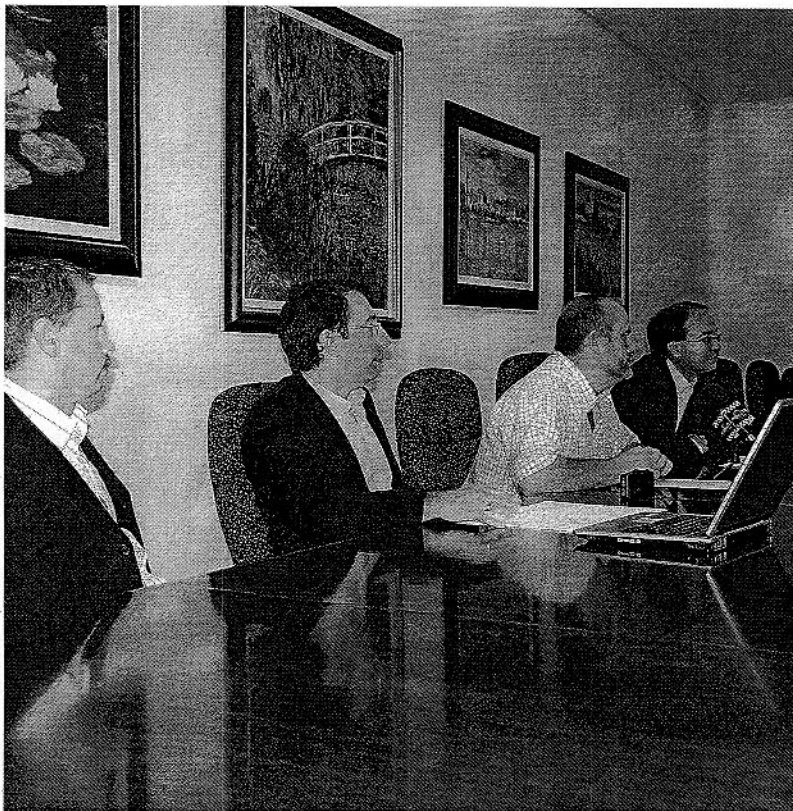
GRUPO. Miembros del Comité Organizador presentan el evento.

El programa científico del congreso consta de tres conferencias plenarias a cargo de tres matemáticos de primerísimo orden mundial, cuyos temas son de interés general para todos los participantes en el congreso, y de 9