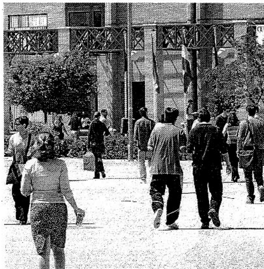
JÓVENES. Alumnos de la Universidad de Almería.

El objetivo principal del proyecto es mejorar las aptitudes y competencias individuales de los universitarios y facilitar su inserción en el mercado laboral mediante estancias de prácticas en empresas europeas. Para los estudiantes de la UAL este proyecto supo-