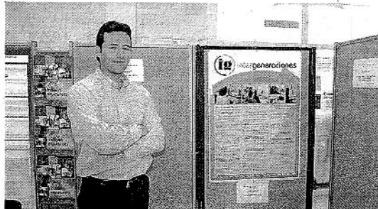
ACCÉSIT. Uno de los promotores de 'Intergeneraciones'.

Los participantes pueden además acceder a financiación a través de las líneas de ayuda para emprendedores de la Agencia Idea, dependiente de la CICE, al igual que la Oficina de Respuesta Unificada (ORU), que ofrecerá su ayuda a los futuros empresarios para realizar los trámites necesarios para poner