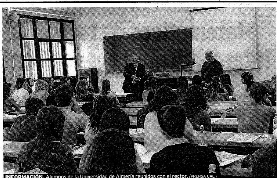
INFORMACIÓN. Alumnos de la Universidad de Almería reunidos con el rector.

Uno de los mayores placeres a la hora de emplear el tiempo de ocio es, sin duda, la lectura. ¿Es, o lo ha sido? En la actualidad esta pregunta se plantea bastante a menudo. La sociedad actual basada en las nuevas tecnologías de la comunicación como internet, telefonía móvil... deja poco espacio al hábito de la lectura. En España cada vez se lee menos, es una de las conclusiones a la que se llega en la mayoría de los estudios que se realizan sobre el tema. Y la juventud apenas se interesa por los libros. Uno de los problemas que se crean es la falta de cultura a la hora de expresarse con corrección, tanto por escrito como oralmente, como se demuestra si atendemos a los 'famosos' mensajes sms. ¿Cómo fomentar la lectura entre los más jóvenes? Es tarea harto difícil, ya que gran parte de este sector de la sociedad no sólo no se interesa por los libros, sino por ningún otro formato impreso. Una 'esperanza' podría darla la reciente y creciente afición de los lectores españoles por la novela o ensayo actuales y 'superventas'. Son los libros conocidos como 'best sellers'. En la mayoría de las ocasiones no son grandes clásicos de la literatura, pero parece la única forma posible de 'enganchar' al mayor número de público al hábito de la lectura. Si además estos libros incitan a la reflexión, mejor que mejor.