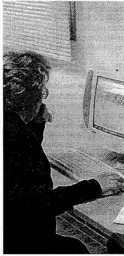
ALUMNO. del Programa. /P. UAL

Todas estas culturas, según explican los organizadores, han sido pioneras en los cambios culturales y tecnológicos acaecidos a lo largo de toda la prehistoria almeriense, a través de la elaboración de piezas de su ajuar doméstico como son las cerámicas y complementariamente un aprendizaje de dibujo arqueológico para la restitución de estas piezas, y un conocimiento temático mediante