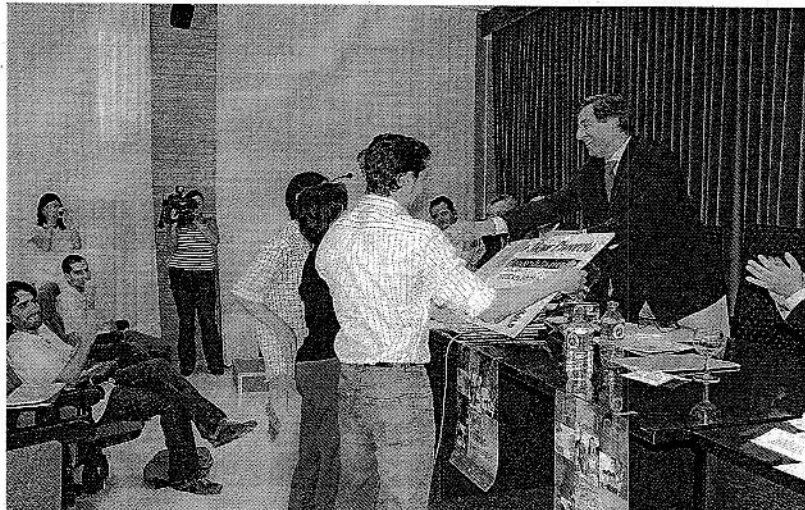
GANADORES. Emprendedores que han presentado el proyecto posan tras el veredicto.

La Consejería de Empleo aporta a los premios una cuantía de