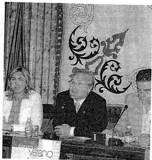
NOVEDAD. Presentación del curso en el municipio.

En cuanto a la posibilidad de que desaparezcan algunas carreras de Letras con la Convergencia Europea, Ana Rossetti señala que no le parece bien, pero que lo que más le preocupa es la educación de base, desde los primeros años de escolarización.