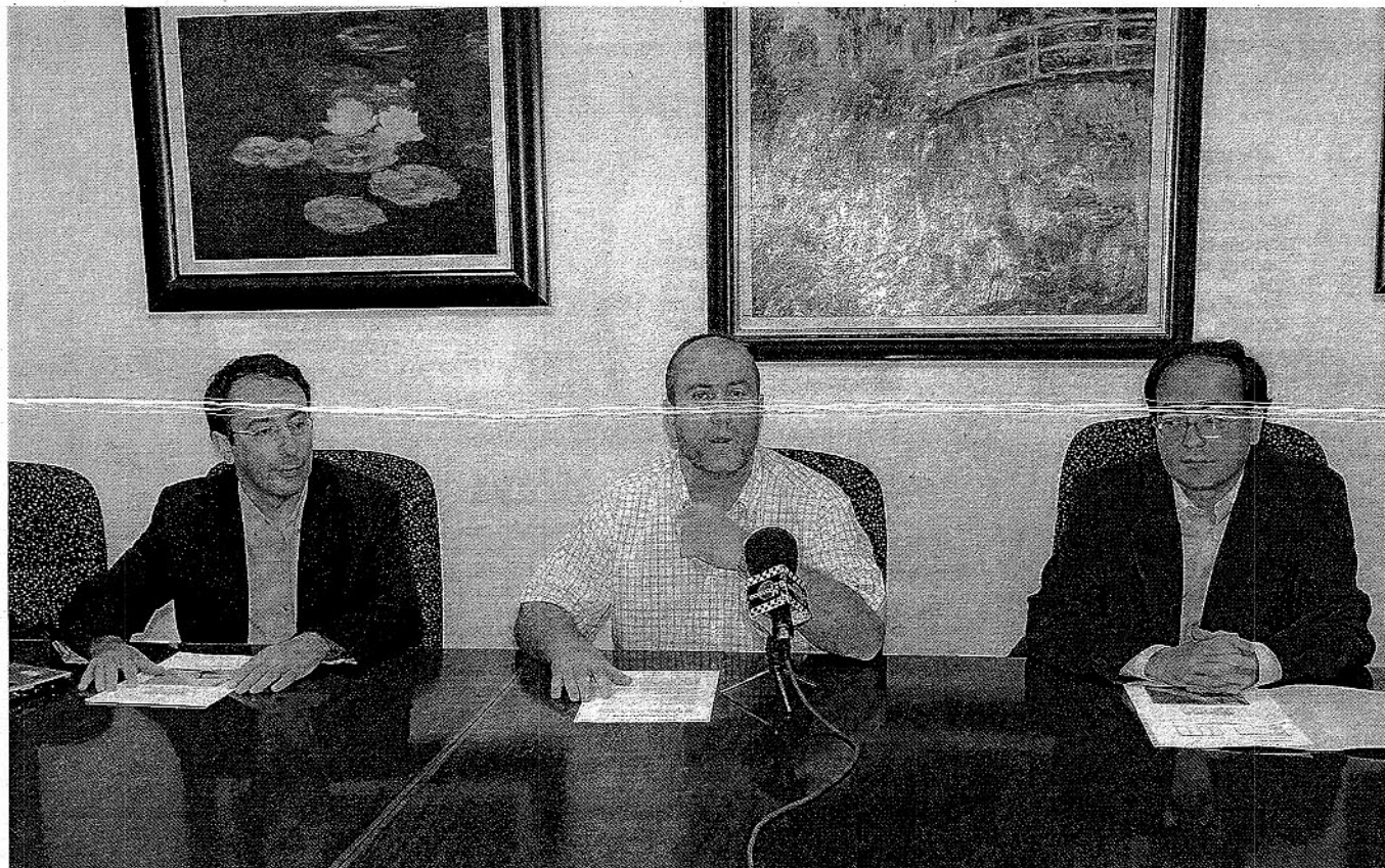
ORGANIZADORES. Matemáticos de la Universidad de Almería presentan el evento en la sede del Consejo Social.