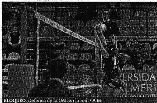
BLOQUEO. Defensa de la UAL en la red.

El largo viaje a Castellón no impidió que el conjunto almeriense lograra imponerse en un estreno liguero en un encuentro que terminó con 0-3 con clara superioridad visitante que sólo tuvo ciertas dificultades en el segundo set. Ila Grau se vio superado por las jugadas rápidas y la capacidad de resolución en los momentos complicados como el final del segundo set que terminó con 26-28.