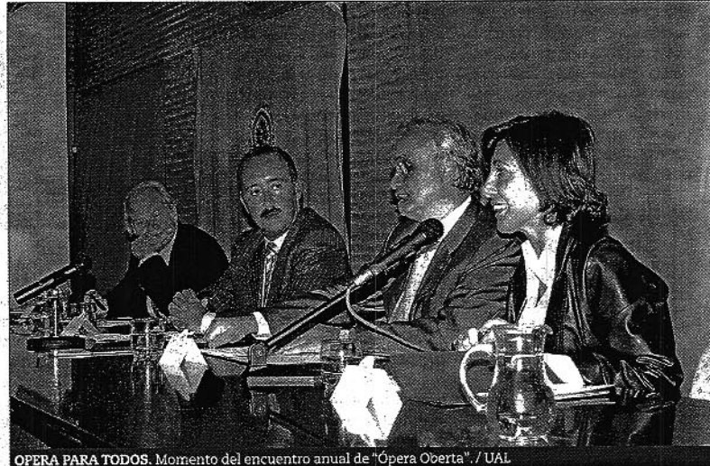
OPERA PARA TODOS. Momento del encuentro anual de "Ópera Oberta", UAL

● La UAL ha sido la sede del encuentro anual de este curso, en el que participan una treintena de universidades de toda España