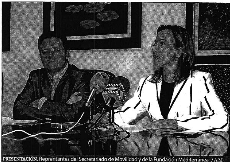
PRESENTACIÓN. Representantes del Secretariado de Movilidad y de la Fundación Mediterránea. / A.M.