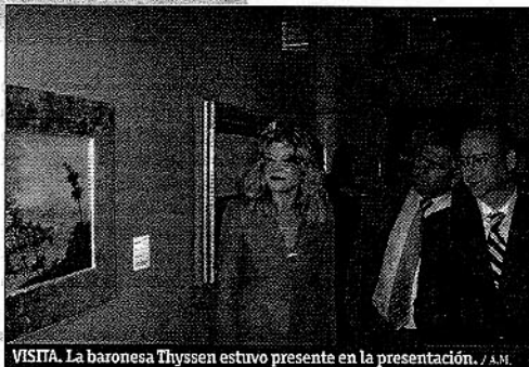
VISITA. La baronesa Thyssen estuvo presente en la presentación. / A.M.

Esta muestra está considerada como una de las más completas de las realizadas hasta el momento en este género, ya que ofrece un recorrido panorámico por la pintura andaluza del movimiento romántico al regionalista. La Fundación Unicaja ha hecho posible que llegue a la capi-