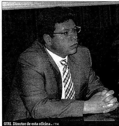
OTRI. Director de esta oficina. / UAL

El personal de la Universidad de Almería, y en especial los más allegados al catedrático, aún se encuentran traumatizados por una noticia que se fue conociendo paulatinamente el pasado lunes en una jornada transcurrida con sentimientos de luto en el Campus de la Cañada.