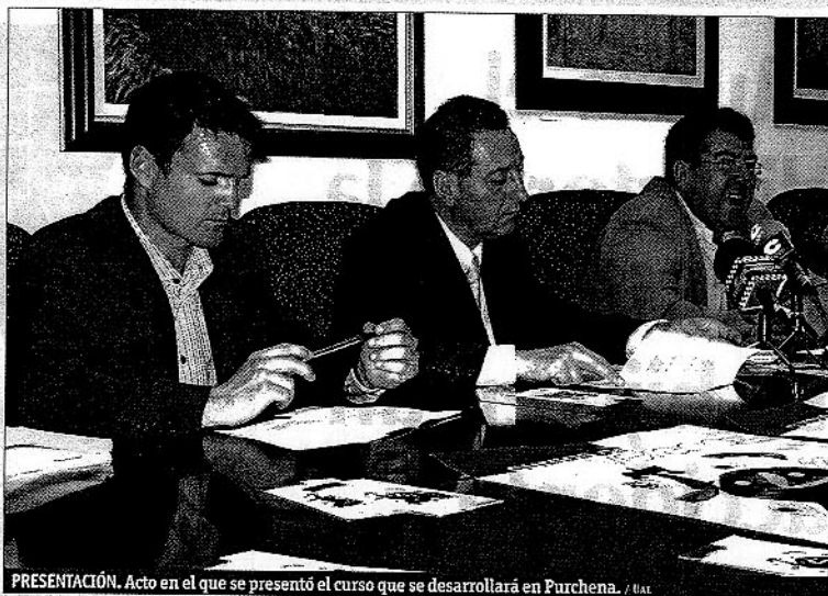
PRESENTACIÓN. Acto en el que se presentó el curso que se desarrollará en Purchena.