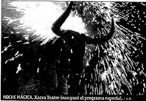
NOCHE MÁGICA. Xarxa Teatre inauguró el programa especial. J.A.M.

Durante todo este año, con motivo de la celebración de los Juegos Mediterráneos, se van a llevar a cabo diferentes iniciativas en la capital almeriense que pretenden fomentar un diálogo multicultural entre los pa-