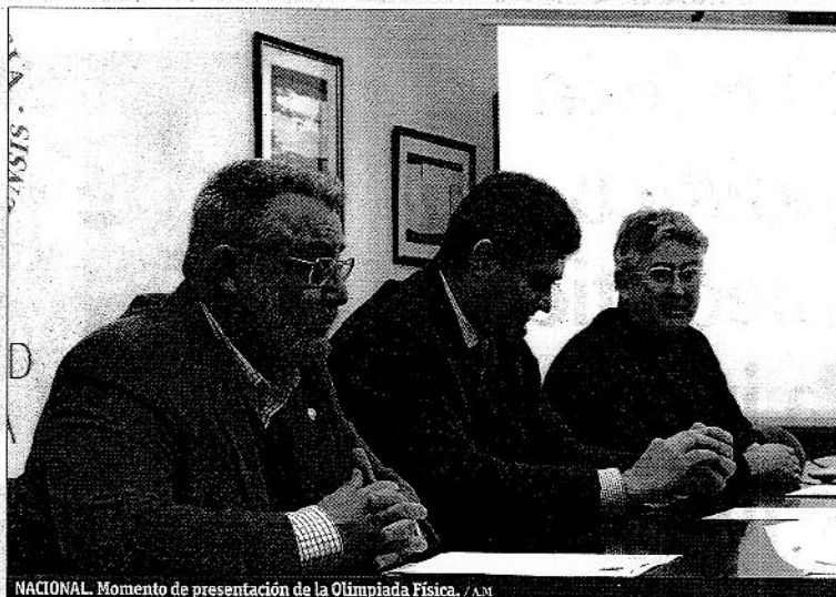
NACIONAL. Momento de presentación de la Olimpiada Física. / AM