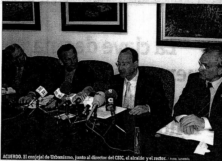
ACUERDO. El concejal de Urbanismo, junto al director del CSIC, el alcalde y el rector.