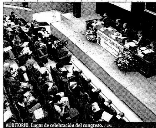
AUDITORIO. Lugar de celebración del congreso.

En esta edición cuenta con el patrocinio del Parlamento de Andalucía, Ministerio de Trabajo y Asuntos Sociales y la Secretaría de Estado de Inmigración y Emigración. Colaboran además la UAL, Canal Sur, Diputación de Almería, Patronato Provincial de Turismo, Consejería para la Igualdad y Bienestar Social, Colegio Oficial de Diplomados en Trabajo Social y Asistentes Sociales de Almería, grupo inmobiliario INFAD y Caja Murcia.