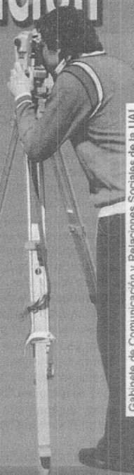
Gabinete de Comunicación y Relaciones Sociales de la UAL

Que los profesionales que salen de las Aulas de la UAL son unos de los mejores formados del país no es ningún farol. Según los últimos datos estadísticos oficiales nuestros titulados son los primeros que consiguen trabajo a nivel andaluz y los quintos a nivel nacional. Y no es por casualidad. Una sociedad en constante evolución demanda respuestas rápidas y una Universidad que sepa adaptarse y buscar los cursos que se adapten mejor a las demandas del mundo empresarial y profesional.