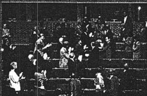
1979. Nace el Parlamento Europeo.