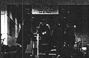
1995. Tratado de Schengen.