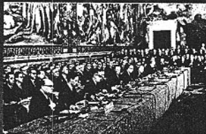
1957. Tratado de Roma.