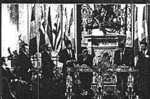
1985. Firma de adhesión de España.