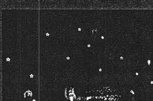
2002. Entra en vigor el Euro.