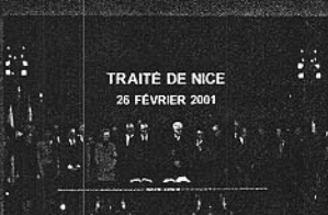
2001. Tratado de Niza.