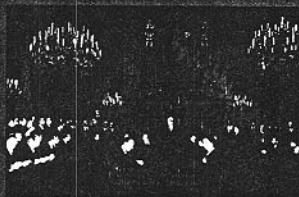
1950. Declaración de R. Schuman.