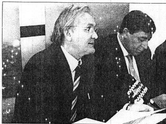
El rector, junto al presidente del Consejo Social de la Universidad

De este modo, la oferta de titulaciones de la Universidad de Almería se amplía con dos más, permiti-