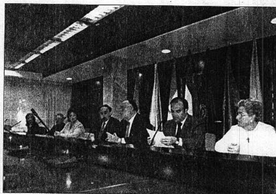
El vicerrector de Estudiantes y el delegado de Igualdad, (centro)