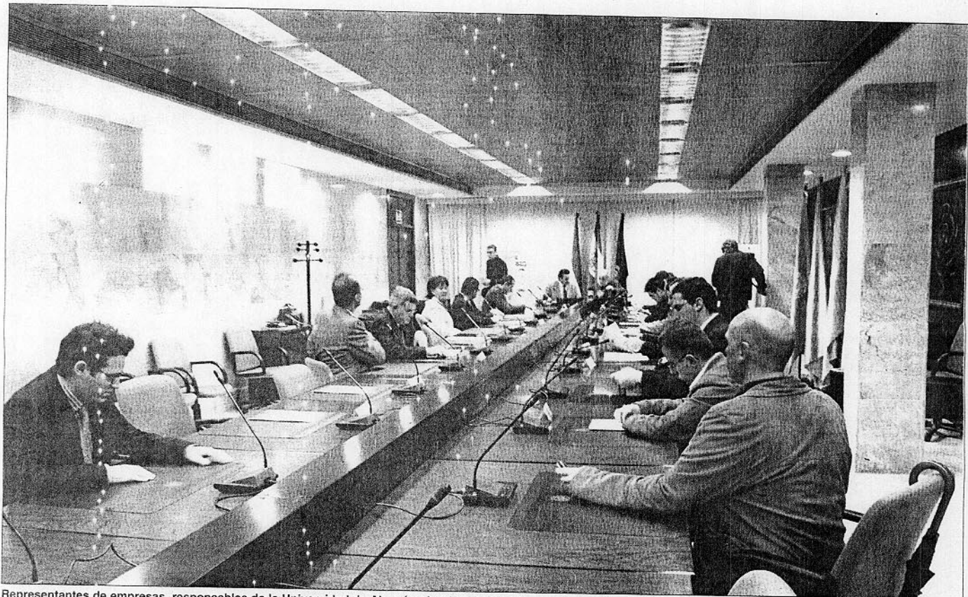
Representantes de empresas, responsables de la Universidad de Almería y la Dirección del Master de Gestión de Recursos Humanos, ayer durante la firma de los