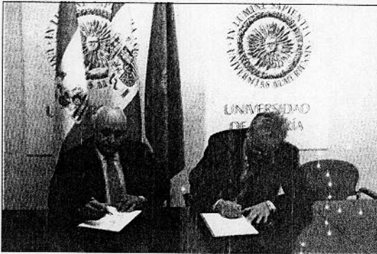
El presidente de Verdiblanca y el Rector en el momento de la

En concreto son 80 personas con discapacidad las que diariamente, durante 44 jornadas, acudirán a esta aula, en horario de mañana, tarde y noche, donde am-