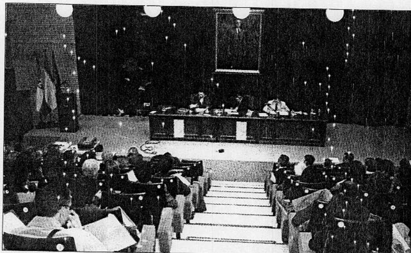
Acto de clausura de las 'Jornadas de estudio y debate sobre la enseñanza de las religiones'