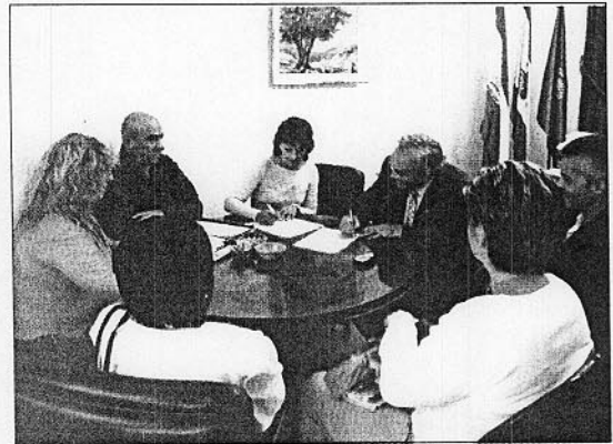
El Rector, junto a los responsables de 'Mediadores sin Fronteras'