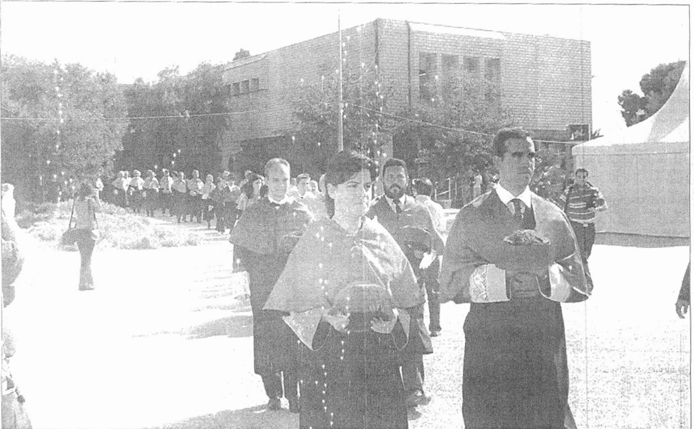
Los nuevos doctores, camino del Auditorio de la UAL donde el rector les impondría, posteriormente, los birretes de sus diferentes facultades