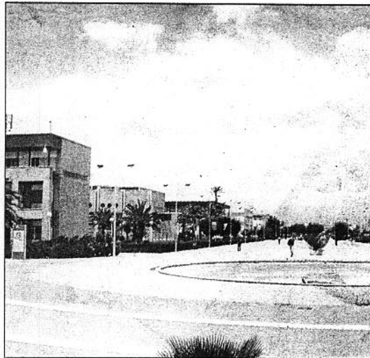
El campus celebra elecciones en centros y departamentos /R. D.