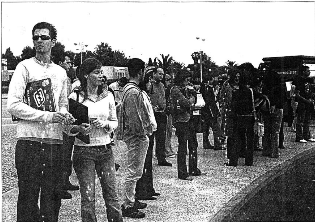
Los estudiantes son el principal activo de la UAL. Los futuros alumnos califican el campus con una nota que roza el notable / R.D.