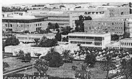
Campus de la Cañada

La UAL colabora con algunos de los nuevos países de la UE