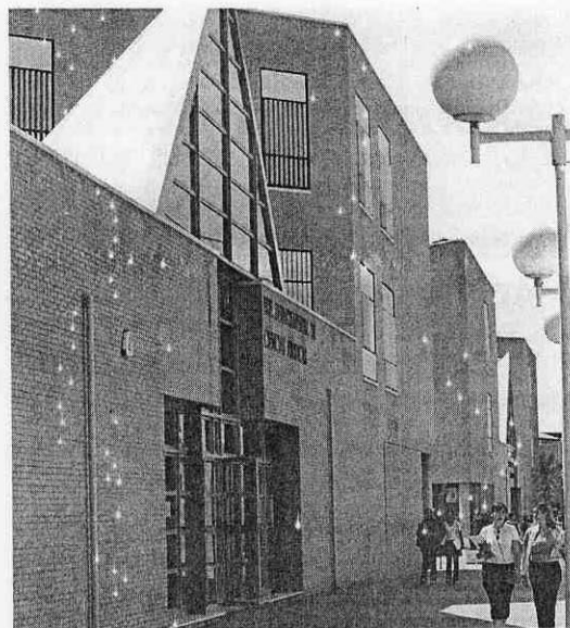
CAMPUS. Facultad de Derecho en la universidad de Almería.

Según el Ayuntamiento, a través de esta actividad cultural se ha querido celebrar el XXV Aniversario de la entrada en vigor de la Carta Magna. Del mismo modo, la Universidad de Almería también celebró los 25 años de Constitución hace unos meses con diferentes actividades donde se reflexionó sobre la importancia de la misma y sus posibles cambios.