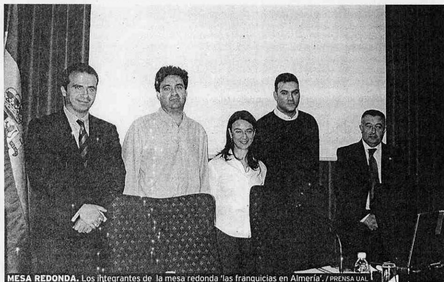
MESA REDONDA. Los integrantes de la mesa redonda 'Las franquicias en Almería'.

Estamos de enhorabuena, diez nuevos socios se han incorporado a la gran familia de naciones que componían la unión monetaria, política y, a partir de ahora, geográfica, del Viejo Continente. Con la adhesión de los países del Este vuelve a demostrarse que el mundo hacia el que nos dirigimos no puede tener fronteras. Pero aún queda mucho camino por recorrer. Mientras Europa se vertebra, otras zonas del Globo se desmembran. Mientras el Islam sigue su lucha contra Occidente y África sigue siendo el continente con más recursos y más pobreza, el pasado 1 de mayo todos los europeos celebrábamos una gran fiesta. Mas no por ello debemos rendirnos, la UAL sigue acercándose a nuestros vecinos más jóvenes de la Unión. Ante el potencial que ahora se abre para los jóvenes, la UAL sigue suscribiendo acuerdos con la Europa Oriental, mientras suscita iniciativas en forma de jornadas informativas. Desde el ya veterano programa Sócrates/Erasmus, pasando por el proyecto de prácticas Leonardo, hasta las distintas redes como Eures, desde la Universidad se pretende que los jóvenes conozcan cada vez mejor el entorno que les rodea, y viajen ya sea a estudiar o a trabajar en la nueva Europa. Debemos ser conscientes de la oportunidad que se nos abre y trabajar en una cada vez más sincera unión, sin olvidar que el mundo no se ciña a nuestro hogar.