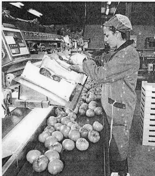
CADENA. Trabajadores en una cooperativa almeriense.

Aunque las cooperativas no son exclusivas de Andalucía, según explicó el ponente, sí que aportó datos del caso andaluz como una «clara muestra» del cambio producido. Los mercados de destino controlados por cadenas, los consumidores cada vez más exigentes con la calidad, la descentralización del sector de la política agraria común y el creciente protagonismo de las organizaciones de productores, entre otros aspectos, son ejemplos del cambios según Emilio Galdeano.