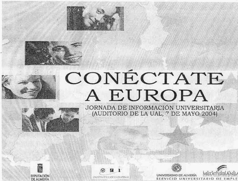
DIVULGAR. Cartel de la Jornada 'Conéctate a Europa'.

A continuación, a las 12.15, tendrá lugar la ponencia 'El programa Juventud de la Unión Euro-