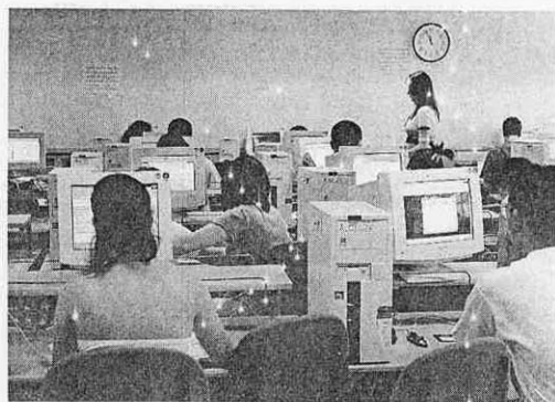
Alumnos de la UAL en un aula de informática.

La concesión de las becas a los departamentos sigue el siguiente baremo: número de tesis doctorales leídas en el departamento durante los últimos 36 meses anteriores a la circulación de la convocatoria; número de tramos de investigación (sexenios) obtenidos por el conjunto de los profesores del Departamento con anterioridad a la circulación de la convocatoria; número de los becarios de iniciación del Plan Propio de Investigación en el departamento durante el curso 2003-04, y número de grupos de investigación.