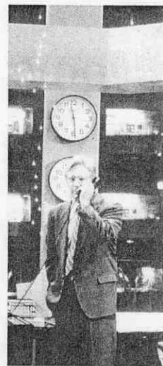
IMAGEN. Cartel de 'Vías cruzadas'.