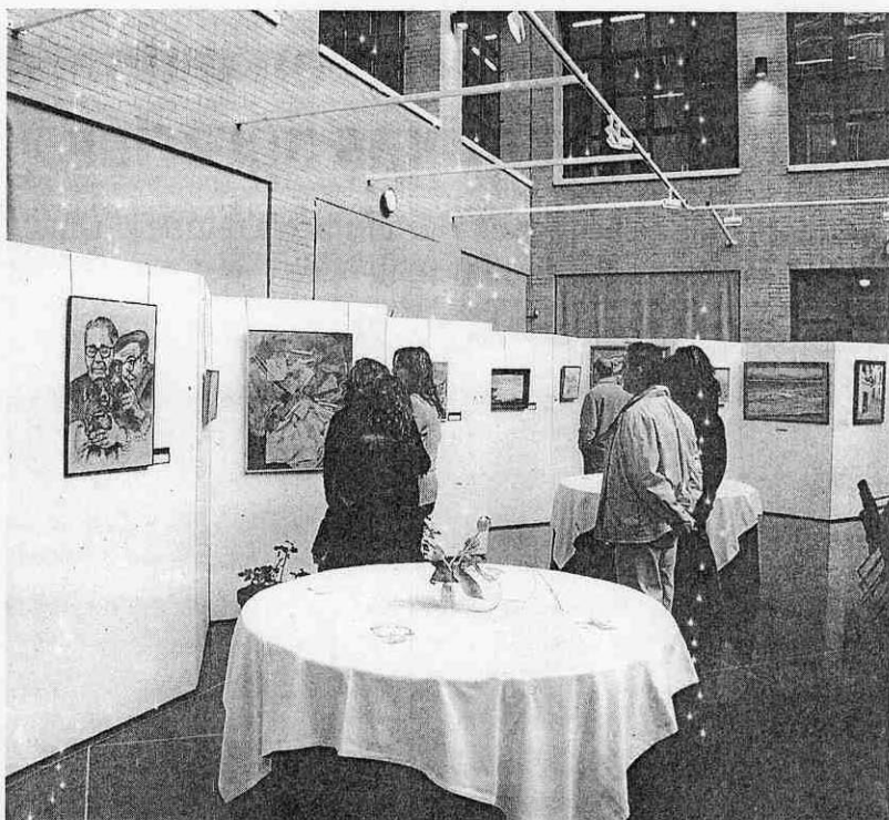
APERTURA. Día de la inauguración en la Sala Bioclimática.

El fotógrafo Miguel Hidalgo es uno de los artistas que exponen estos días en la Sala Bioclimática de la Universidad de Almería. Su obra se centra en el paisaje natural almeriense. En ésta fotografía, la Isleta del Moro.