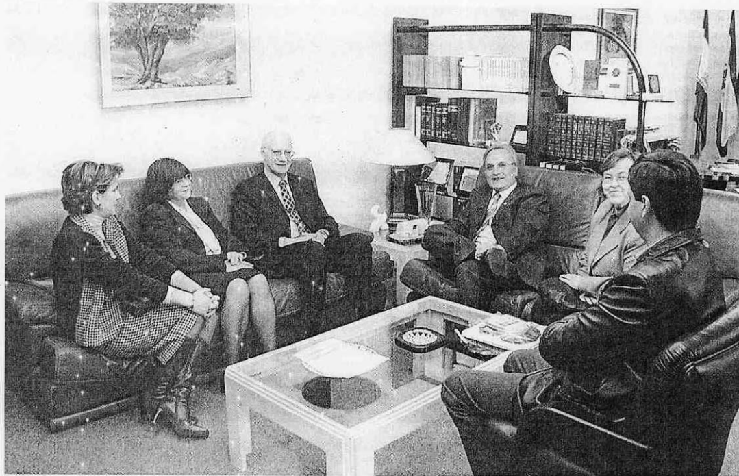
DIÁLOGO. Reunión del rector con representantes de una universidad europea.

Habría que distinguir entre el sistema académico chipriota griego y el sistema académico chipriota turco. En lo que se refiere al primero, la Universidad de Chipre, que abrió en septiembre de 1992, comprende cuatro instituciones (Humanidades y Ciencias Socia-