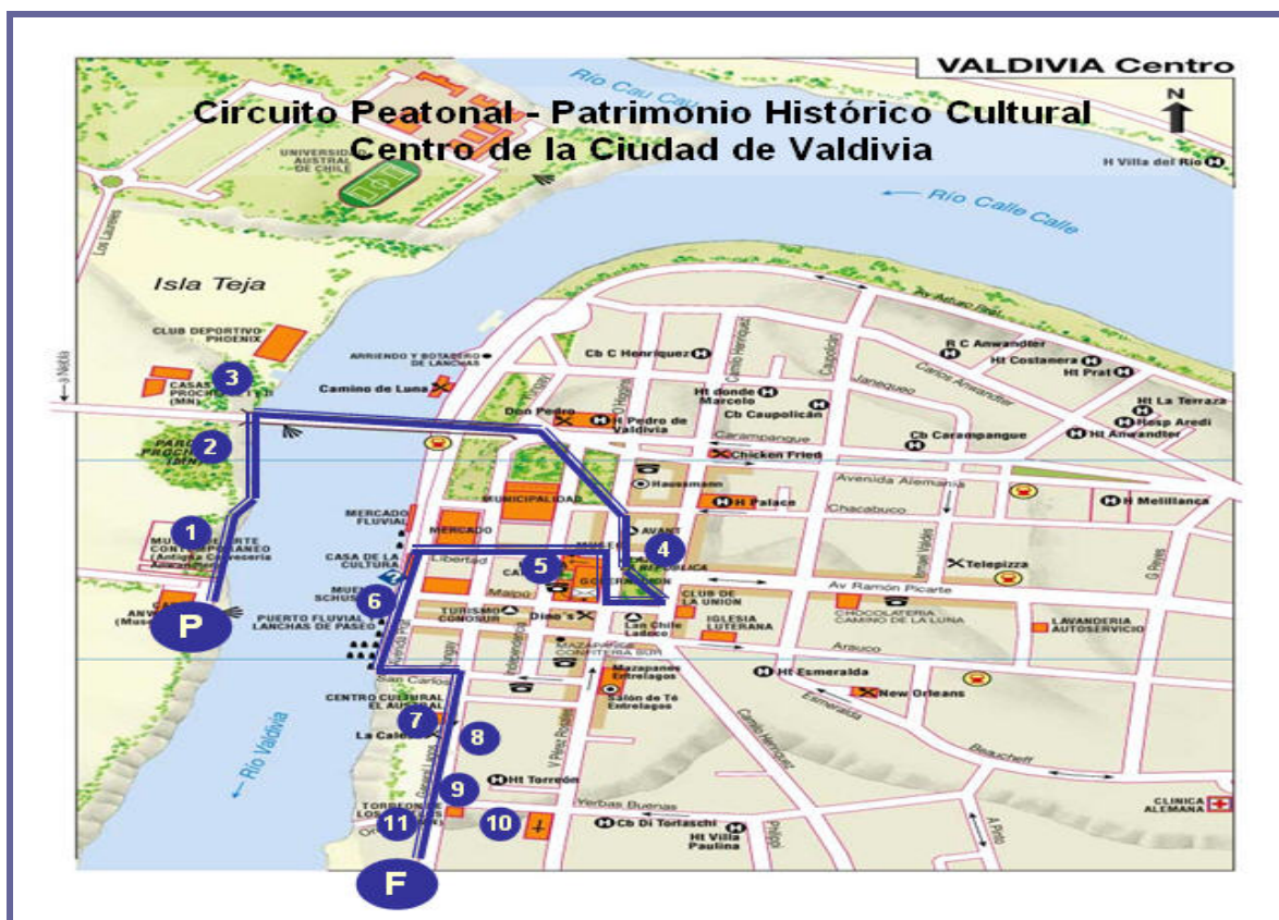
Figura 1. Esquema del circuito propuesto sobre, plano centro de la ciudad de Valdivia.

La población objetivo está constituida por los turistas mayores de 18 años que visitaron la ciudad en los meses del verano del año 2004. El tamaño de la muestra correspondió a un error del 4 por ciento con un 95 por ciento de confianza; finalmente 615 visitantes fueron entrevistados en forma aleatoria sistemática y con estratificación proporcional de turistas nacionales y extranjeros 13 . El trabajo de campo estuvo comprendido entre la última semana de diciembre (2003) y la primera de marzo (2004). Las entrevistas se realizaron en un sector altamente concurrido por los visitantes, cercano a la costanera (Muelle Schuster y mercado fluvial), y en la oficina de información turística de la ciudad, que se ubica en el mismo sector.